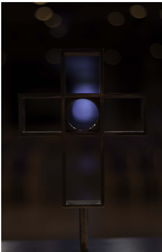
Alterkorset i Østenstad kirke.