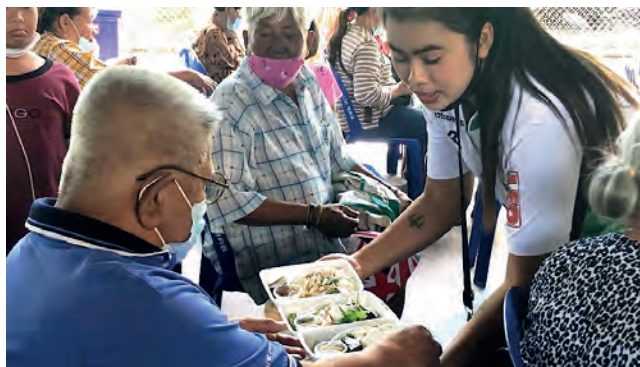
Namvan (diakonarbeider) deler ut mat til en av deltakerne.

Situasjonen i 2020 har vært vanskelig med mye nedstengning. I ELCT har mange aktiviteter blitt avlyst