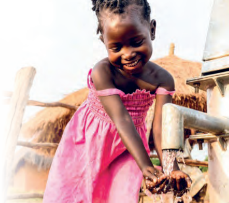
Champo 5 år drikker rent vann fra pumpen i nærheten av hjemmet.

Røyken menighet har bidratt til fasteaksjonen som bøssebærere i mange år. Fjor var vi digitale bøssebærere for første gang, og vi samlet inn nok penger til å gi 107 mennesker et helt liv med rent vann! I år er vi igjen digitale bøssebærere, og vi håper vi å kunne hjelpe enda flere. Følg med på Røyken menighets fasteaksjon på menighetens nettsider, på Facebook og på Instagram («Røyken menighet»).