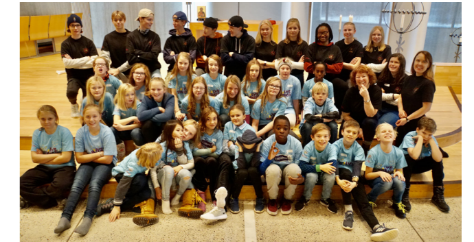
Lys Våken 2019

Lys Våken med overnatting i kirken for 10 - 12 åringer. Dato: 7. - 8. oktober. Alder: 5. - 7. trinn Ledertrening på Lys Våken fra 8. trinn.