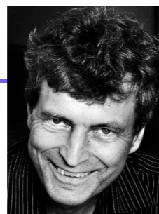
13.10: Dag Hareide

Indre ro mot ytre uro. Hvordan beholde framtidstro i usikre tider?