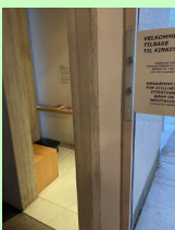
Døgnåpent rom ved inngangen