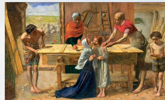
Christ in the House of His Parents ('The Carpenter's Shop') 1849-50; Sir John Everett Millais, Bt 1829-1896; Tate, Purchased with assistance from the Art Fund and various subscribers 1921

Det var likevel ingen andre måtar å bli menneske på for Gud enn å gå heile vegen inn i det konkrete. Guds son landa midt i verda vår med alt det som følgjer med livet i kjøtet: blod, arbeid, støv, sveitte og husdyr. Jesus viser oss at ingenting menneskeleg, sjølv ikkje det aller lågaste og vanlege, er skjult eller framand for Gud. Det gjeld framleis. Guds son har delt livets vilkår og veit kven vi er. Vi treng difor ikkje bruke mange ord når vi ber, men kan nemne