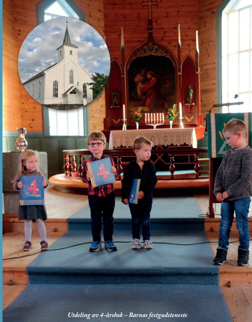
Utdeling av 4-årsbok – Barnas festgudsteneste

KYRKJEBAKKEN Informasjonsblad for Austrheim sokn