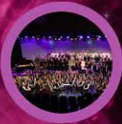
ELEVAR, GJESTAR, KOR OG KORPS