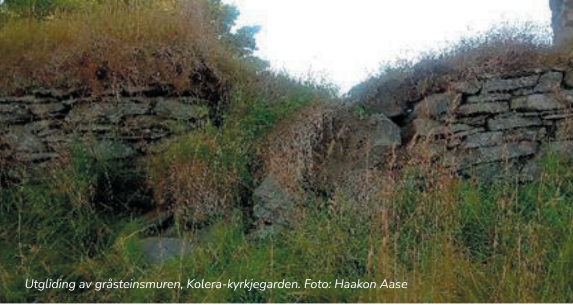
Utgliðing av gråsteinsmuren, Kolera-kyrkjegarden.