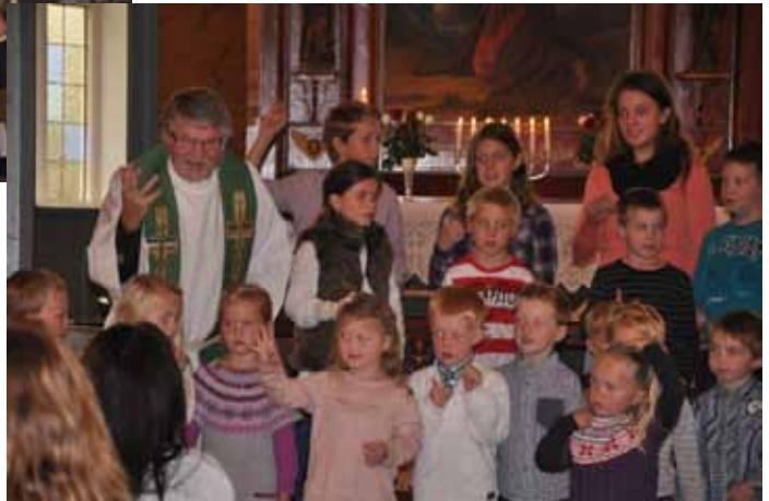
Frå Søndagsskulens dag.