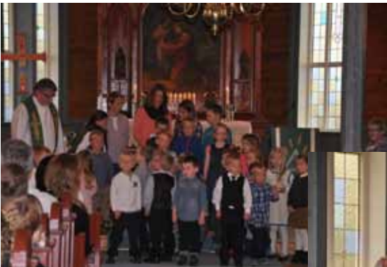
Frå Søndagsskulens dag.