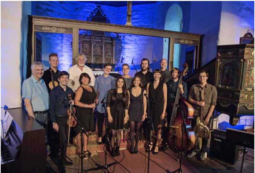
askvik5 og gode vener - frå innspelinga i sommar.