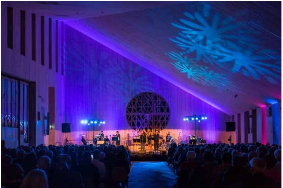
Frå konserten i Knarvik laurdag 8.oktober