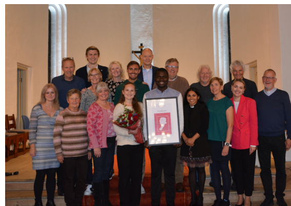
Staben i Salhus mottok Medierosen sammen med NRK for påskegudstjenestene som ble sendt på NRK tv.