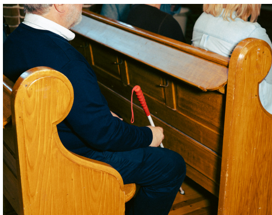
Inkludering gjør det mulig for alle å delta på arrangementene våre.

Inkludering handler både om universell utforming og individuell tilrettelegging. I gjennomgangen av kurset får man innsikt i ulike funksjonsutfordringer og forskjellige behov. I løpet av 2022 ble det arrangert fagdag for alle interesserte menigheter.