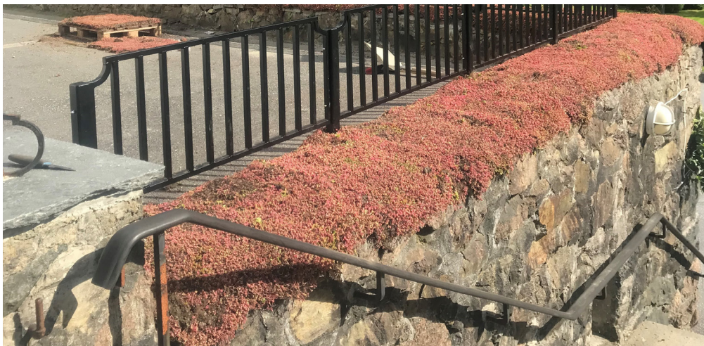
Nytt gjerde og beplantning med muren til Salhus kirke er kommet på plass. Trappen skal også rehabiliteres.

I Ytrebygda kirke forberedes innsetting av nye glassmalerier. Dette er finansiert gjennom testamentarisk gave. Menigheten har lenge planlagt kors på utsiden av kirken for å synliggjøre at dette er et kirkebygg. Korsene ble godkjent og montert i 2022, betalt av menigheten.