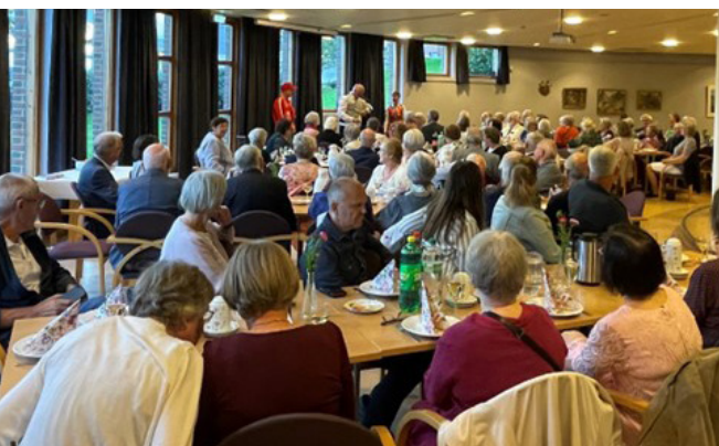
Frivillighetsfest i Åsane kirke.