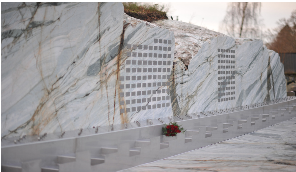
1. desember åpnet en ny minnelund i Fana, formgitt av Erik Bjerkelund.

Tilstandsanalysene for både anlegg og bygg gjennomføres planmessig. Det lages vedlikeholdsplaner i tråd med funnene i analysene og verneplanarbeidet for gravplassene i Bergen er knyttet sammen med dette arbeidet.