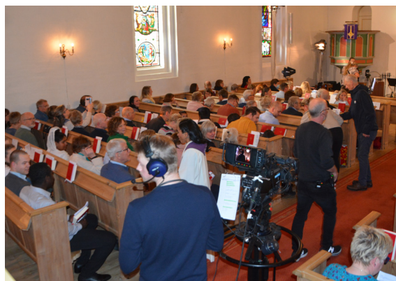
Siste sjekk før innspilling av fullsatt gudstjenester i Salhus.

Etter påske ble menigheten tildelt prisen Medierosen for 2022 sammen med NRK. Tro & Medier deler ut prisen hvert år til en person, en redaksjon eller et program som har utmerket seg ved å fremme kristen tro eller gode verdier i mediene. Prisen ble delt ut i Salhus kirke med kaker og fest. Vi gratulerer med velfortjent pris!