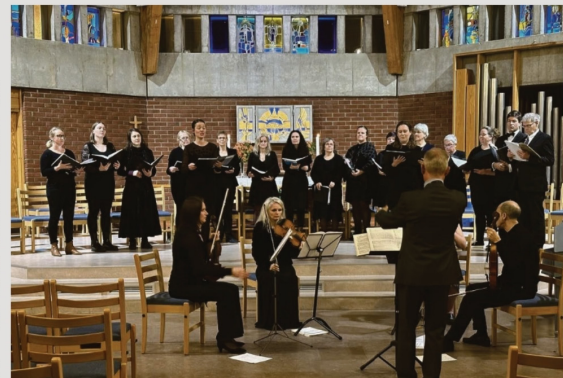
Faksimile fra Sydvesten 27. oktober 2022

Det er kjempeviktig for vi har i en kjempeviktig bedrift.