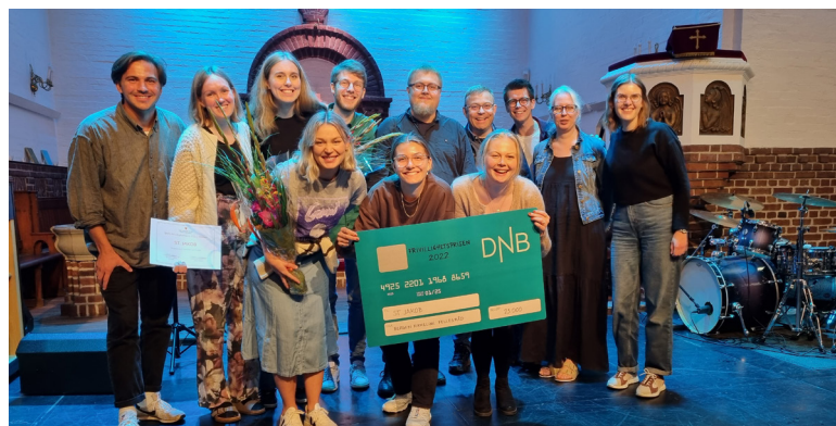
Noen av de frivillige og ansatte i St. Jakob.