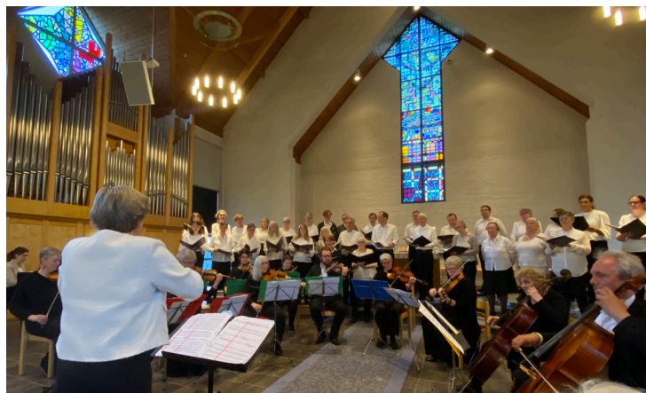
Fra jubileumskonserten.