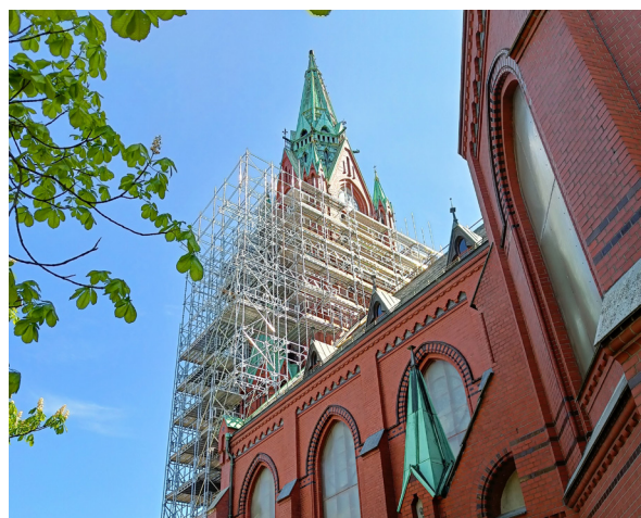
Johanneskirken fikk stillas og ble pakket inn i plast i 2023.