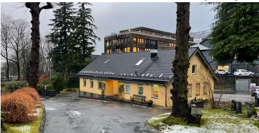
Driftsbygget på Møllendal har fått nytt tak.

I november ble det gjennomført en brukerundersøkelse rettet mot personer som sørget for en gravferd i Bergen i løpet av første halvår 2023. Det ble mottatt 210 svar, noe færre enn sist, men som likevel gir oss et godt