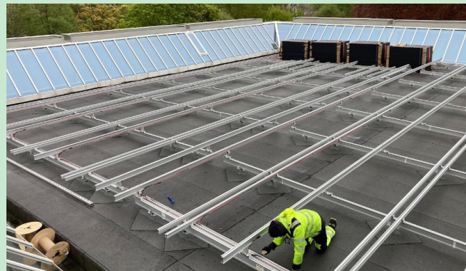
Solcellemontering på Eidsvåg kirke