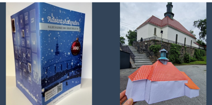
Spennende adventskalender for hele familien.