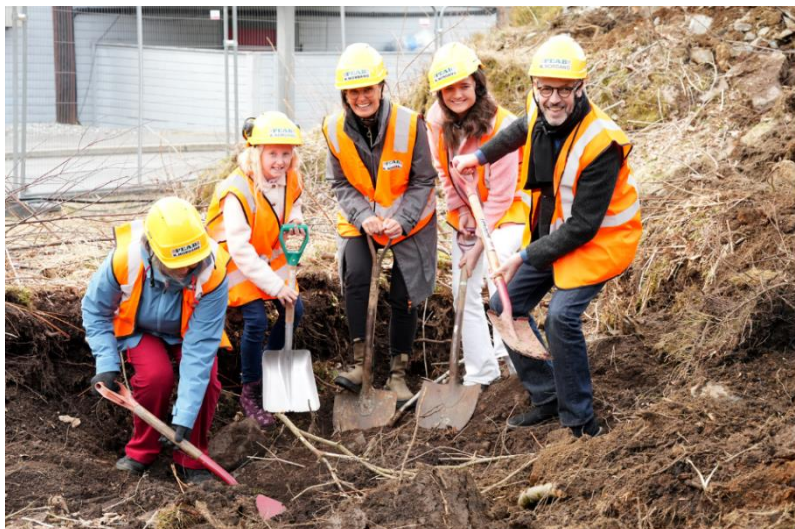
Storstilt feiring av første spadestikk på kirketomten i Sædalen i april 2023