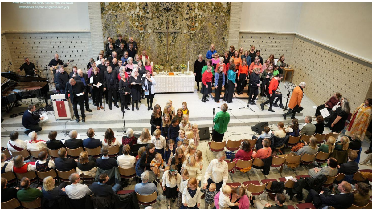
Vigslingsgudstjeneste i Sædalen kirke 3. november 2024