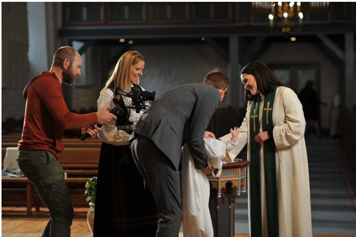
AKSJON DÅP: Innspilling av dåpsfilm i Birkeland kirke, høsten 2021