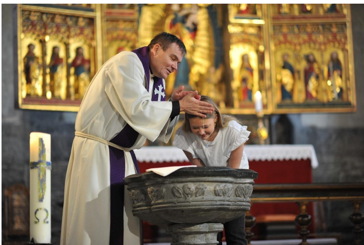
Aksjon dåp 2021 Drop-in-dåp i Mariakirken