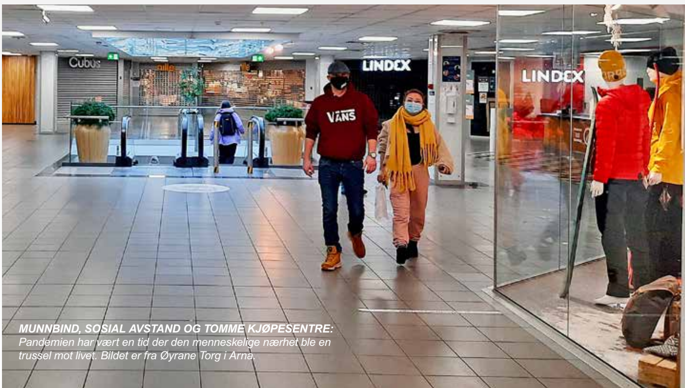
MUNNBIND, SOSIAL AVSTAND OG TOMME KJØPESENTRER: Pandemien har vært en tid der den menneskelige nærhet ble en trussel mot livet. Bildet er fra Øyrane Torg i Arna.

Men òg som et symbol på hvordan et sant liv i må krisetider leves. Som et liv i kjærlighet, forsakelse og håp. Som et rikere liv enn penger kan gi.