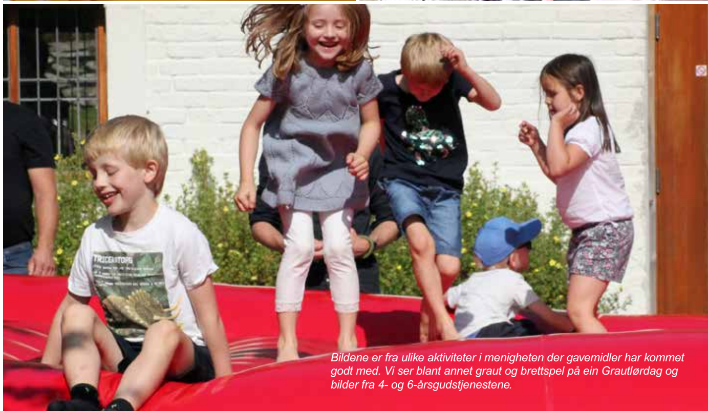
Bildene er fra ulike aktiviteter i menigheten der gavemidler har kommet godt med. Vi ser blant annet graut og brettspel på ein Grautlørdag og bilder fra 4- og 6-års gudstjenestene.