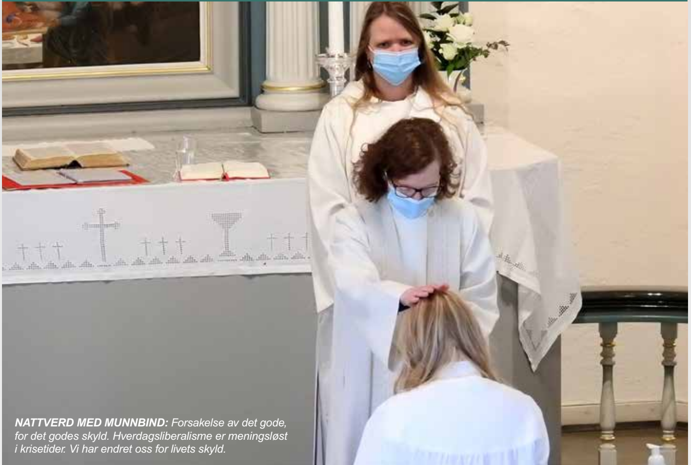
NATTVERD MED MUNNBIND: Forsakelse av det gode, for det godes skyld. Hverdagsliberalisme er meningsløst i krisetider. Vi har endret oss for livets skyld.