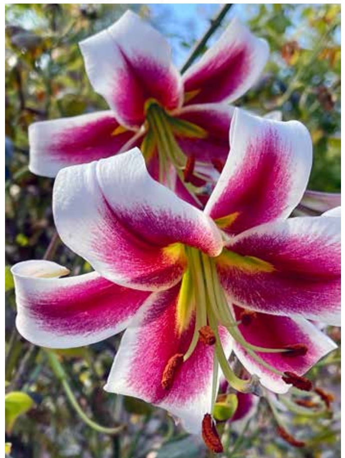
FARGEPRAKT: Liljer får du i mange varianter og høyder. Pass på hvor du setter de så ikke vinden tar dem! Lurt å sette dem et sted du ofte går, så du riktig får glede av dem.

Madonnaliljer er kjent fra hager blant annet i Kristiansand, Tvedestrand og Mandal. Den formerer seg med sideskudd, så den kan leve lenge i hagene og også byttes rundt. Det ville vært spennende om noen som leser Menighetsbladet har en historie fra sin familie om madonnaliljen!