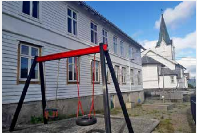
Noa open barnehage held til i kyrkjelyshuset rett bak Ytre Arna kyrkje.

Facebook! Velkomen til ein sosial og koselig dag i Noa open barnehage!