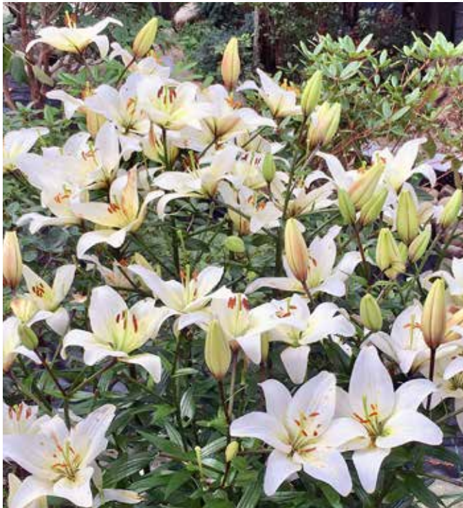
MADONNALILJER: Det finnes mange ulike typer hvite liljer, med små variasjoner. Madonnaliljen er nok en som mange er svært glad i.

Liljene er vakre, og nå utover høsten ser vi ekstra mange av dem i mange hager. De finnes i så mange farger, så mange fasonger – enkle, doble – men felles for de fleste er at de dufter himmelsk!