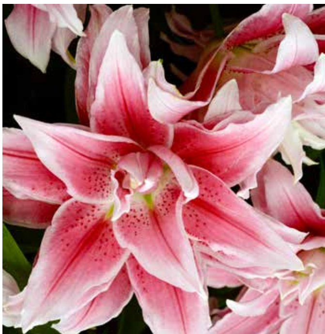
DOBBELT SETT MED KRONBLADER: Isabellaliljen er typisk for de nye doble liljene. Støvbærerne er vekke, omgjort til kronblader kan man si. Disse vil ikke trekke insekter da de er uten pollen eller nektar.

Nå fremover vil du nok se liljefristelser i butikkene. Du bør bestemme deg fort om du vil ha de, for liljene bør i jorda i god tid før frosten kommer. Rett og slett fordi den da får tid til å danne røtter. Vann godt etter at du har satt den ned, så sikrer du deg at løk og jord har god kontakt fra første stund. Plantedybde: tre ganger løkens bredde/høyde. Ta vare på navnelappen! Det er alltid kjekt å vite hva liljen heter om du får spørsmålet. Jeg tar bilde med mobilen, legger bildet i en mappe (også på mobilen) som heter Mine blomster, og så vet jeg at skulle navnelappen forsvinne, så har jeg en backup.