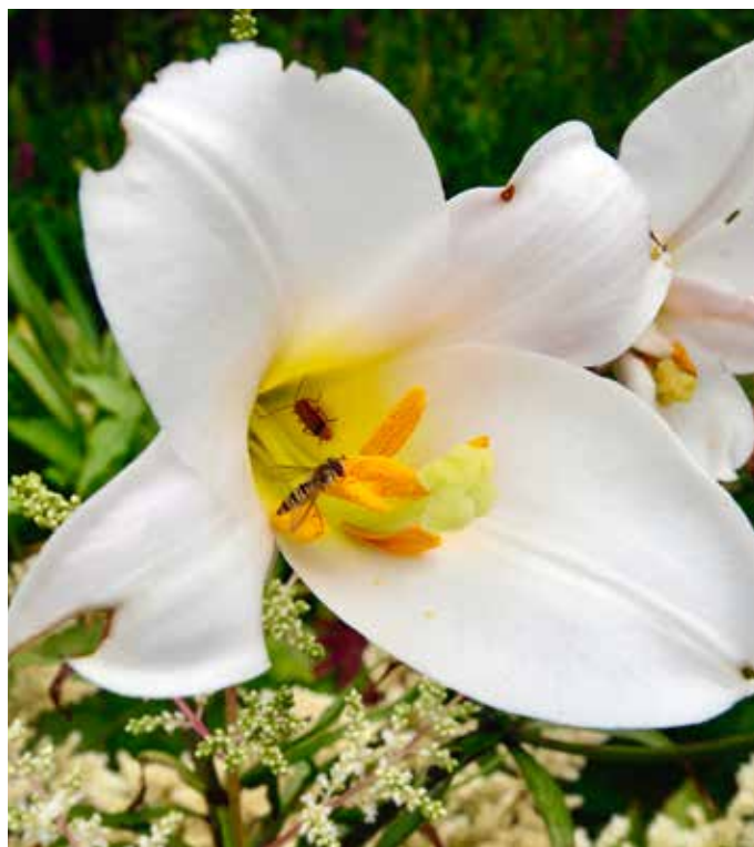
INSEKTMAGNET: Liljene trekker til seg mange og varierte utvalg av insekter – når de er åpne og ikke doble. Da dufter de også mest!