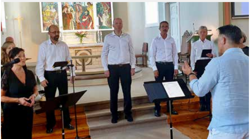
Her syng Ytre Arna vokal i Ytre Arna kyrkje 29. august.

Ynskjer du å syngje med Ytre Arna Vokal? Me øver kvar torsdag i Ytre Arna kyrkje kl. 19 -21.30.