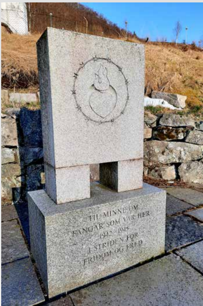
ET LIV I KJÆRLIGHET, LIDELSE OG HÅP: Symbolet som er hugd ut i støtta i Espelandsleiren sier noe om hvordan et sant liv i krisetider leves.