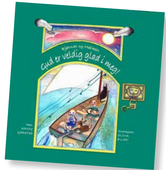
Den nye boken er den tredje i serien om Bjørnar og Maiken.

Noen uker senere møtte Wendy illustratøren Olivia Filippi og et forlag som tente på ideen. Den første boken ble utgitt og mange barn fikk bli kjent med Bjørnar og Maiken.