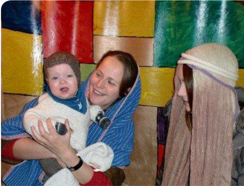
Foto fra Betlehemsvandringen i 2012

Ja, i kvart hjarte armt og mørkt Send du ein stråle blid, Ein stråle av Guds kjærleiks lys i signa juletid!