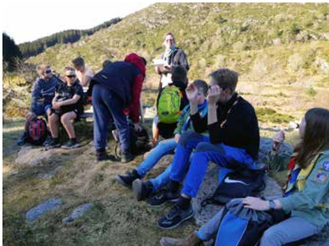
VILL VAKKER VANDRING: Vi lærte om postveiens historie og så på landskapet rundt veien i lys av skapelsesberetningen.

Til helgen i samme uken måtte lørdagsopplegget for 10-åringer (Sang, sal, scene) dessverre skrinlegges på grunn av dårlig