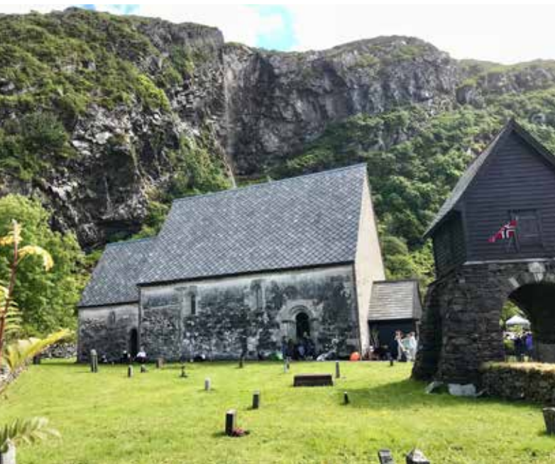
KINNAKYRKJA: Den gamle steinkirken på Kinn ble bygget en gang mellom årene 1150 og 1200.

TEKST OG FOTO: SYNNØVE NORSTRAND OG BJØRN NORSTRAND