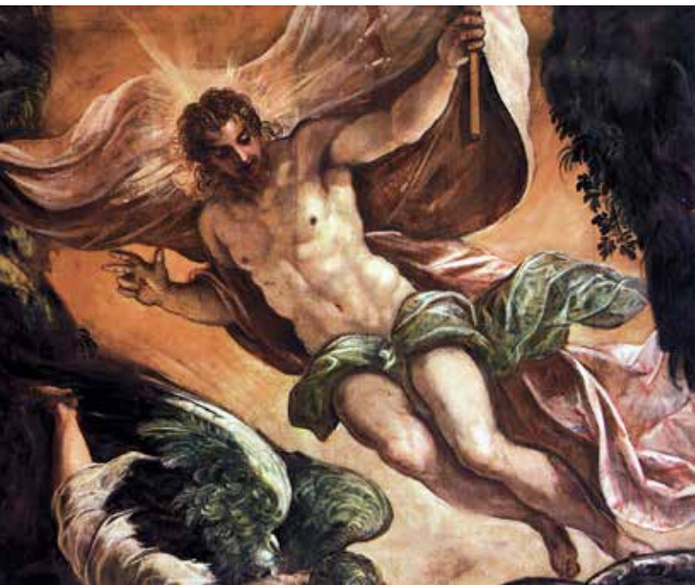
JESU OPPSTANDELSE: Utsnitt fra oljemaleri av renessansemaleren Jacopo «Tintoretto» Comin (1518-1594).

For den kristne kirke er denne dagen blitt kjernen, kvintessensen, i selve trosbegrepet. Jesu oppstandelsesdag, den første dag i uken, er blitt den kristne kirkes største festdag.