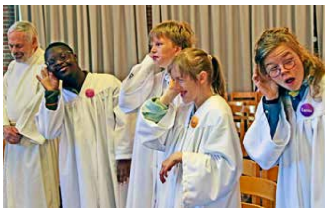
LYTTER TIL KLOKKESLAGENE: Etter at velsignelsen er lyst, ringes det i kirkeklokken med tre ganger tre slag.