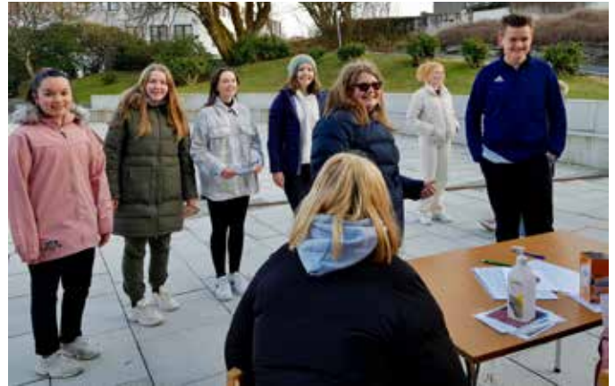
En annerledes korøving for Sanctus

Haukås Nærkirke klarte akkurat å få gjennomført konfirmantleir på Dyrkolbotn fjellstove før nedstengingen i høst, men konfirmantene i Åsane kirke har ikke fått reise bort på