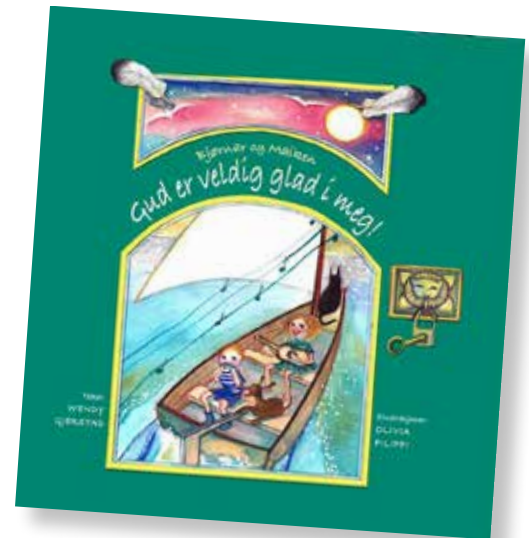
Den nye boken er den tredje i serien om Bjørnar og Maiken.