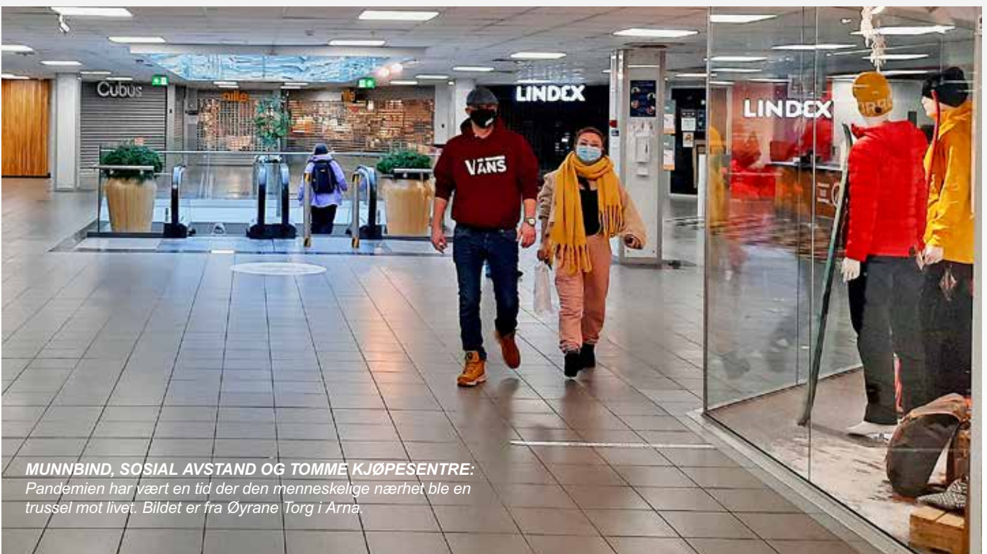
MUNNBIND, SOSIAL AVSTAND OG TOMME KJØPESENTRER: Pandemien har vært en tid der den menneskelige nærhet ble en trussel mot livet. Bildet er fra Øyrane Torg i Arna.

Men òg som et symbol på hvordan et sant liv i må krisetider leves. Som et liv i kjærlighet, forsakelse og håp. Som et rikere liv enn penger kan gi.