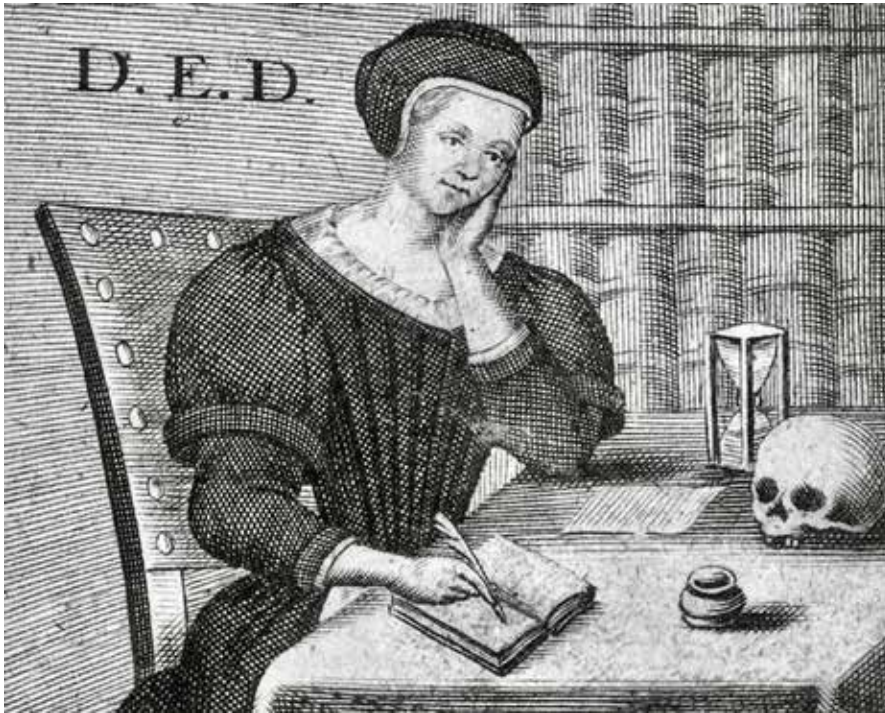
DEN STORE SALMEDIKTEREN FRA BERGEN: Dorothe Engelbretsdatter var en kjent og aktet dikter allerede i sin samtid. Hennes salme «Dagen viker og går bort» (1678) står i Norsk salmebok 2013. (Illustrasjon: Utsnitt av tittelbildet på salmesamlingen «Taare-Offen» (1685), som hun skrev etter at hennes mann døde).