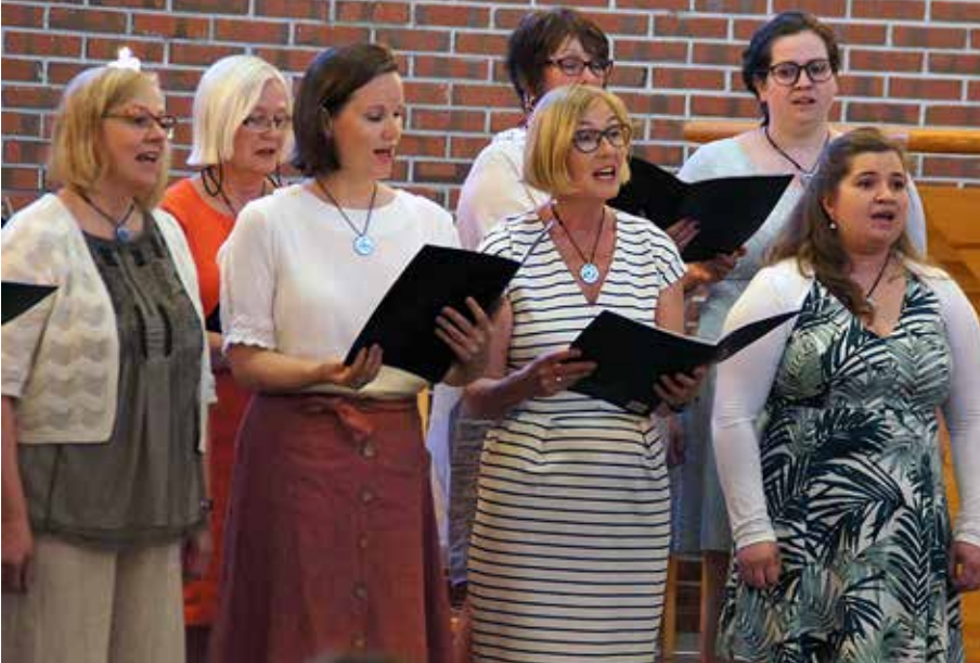
25 ÅR MED CANTUS SORORUM: Korets navn er latin for «søstrenes sang».

På festkonserten serverer vi høydepunkter fra vår musikalske reise. Det blir også nyere sanger av nålevende komponister. Flere av våre samarbeidspartnere er invitert, så vi vil ha med både strykekvartett, organist, pianist, og harpist.