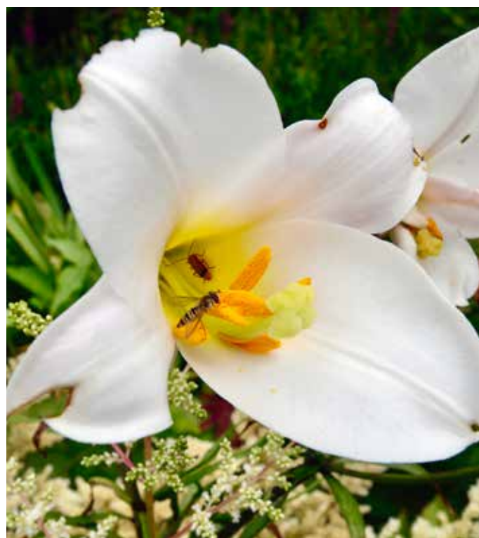
INSEKTMAGNET: Liljene trekker til seg mange og varierte utvalg av insekter – når de er åpne og ikke doble. Da dufter de også mest!

Best av alt liker jeg likevel disse versene fra Høysangen: «Min kjæreste gikk ned til sin hage, til duftende urtesenger. Han ville gjete i hagene og plukke liljer. Min kjæreste er min, og jeg er hans, han som gjeter blant liljene» (Høys 6:2-3). Det er nydelige ord å ha i tankene når du rusler blant dine liljer, ikke sant?