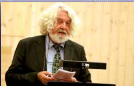
Hoems julesalme Side 14-15