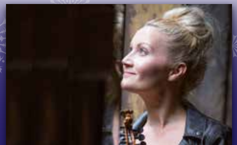
Når orda ikkje strekk til Side 10-11