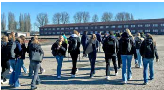
STERKT MØTE: Neuengamme er en av de få konsentrasjonsleirene i Tyskland hvor flertallet av bygningene er bevart. 42900 fanger ble drept her – 14000 i hovedleiren, 12800 i underleirene og 16100 i dødsmarsjene og bombingene i krigens siste uker.