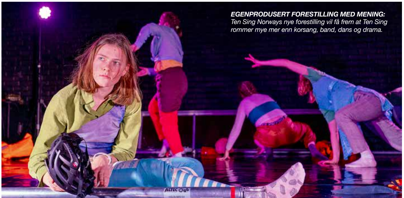
EGENPRODUSERT FORESTILLING MED MENING: Ten Sing Norways nye forestilling vil få frem at Ten Sing rommer mye mer enn korsang, band, dans og drama.