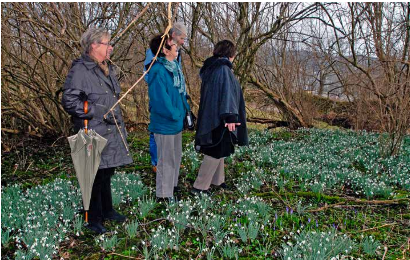
SNØKLOKKETEPPE: Snøkløkker kan vokse tett, og slik danne hvite flater, nesten som snø – og skape et eventyrlandskap for oss alle.

løvfellende trær eller busker. Da får den lys nok til å blomstre før løvet er vokst frem. Senere vil dette løvet gi den ly mot den varme sola så den ikke tørker ut.