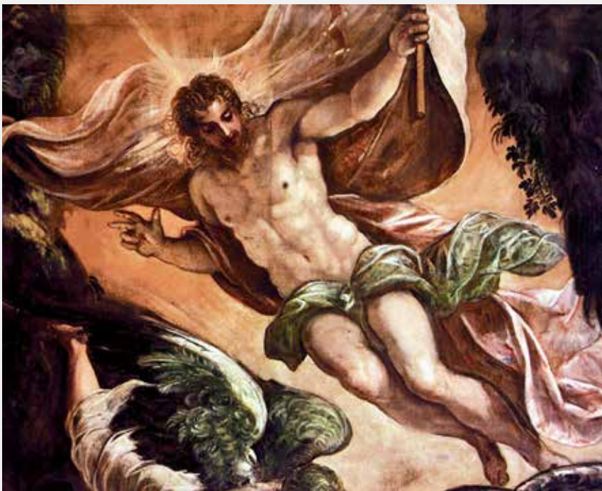
JESU OPPSTANDELSE: De første øyenvitner sammen med Jesu egne ord gir grunnlag for å tro at Jesus stod opp igjen fra graven og er levende også i dag. (Illustrasjon: Utsnitt fra oljemaleri av renessansemaleren Jacopo «Tintoretto» Comin, 1518-1594).

For en tid tilbake siden snakket jeg med en ungdom om tro. Vedkommende fant det ikke vanskelig å tro på at Jesus en gang hadde eksistert og at han til og med kunne være Guds Sønn, men at han stod opp igjen og lever i dag var det umulig å tro på. Ifølge han er fortellingen om oppstandelsen noe kirken har funnet på for at folk skulle fortsette og tro på Jesus etter at han døde.