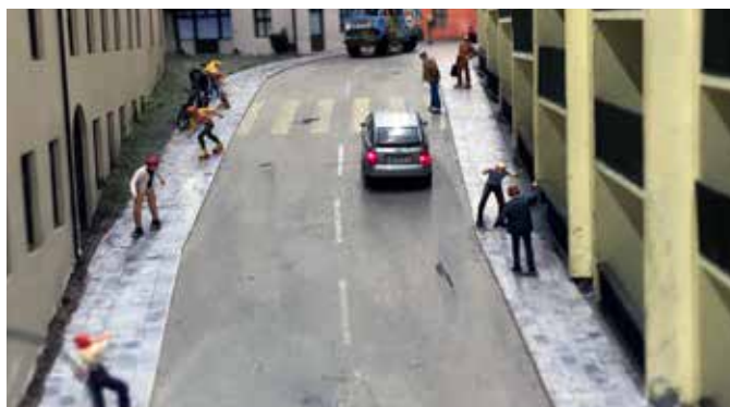
TYSKLANDS STØRSTE ATTRAKSJON: Miniatur Wunderland er en modelljernbane- og miniatyrflyplassattraksjon i Hamburg, og den største av sitt slag i verden.