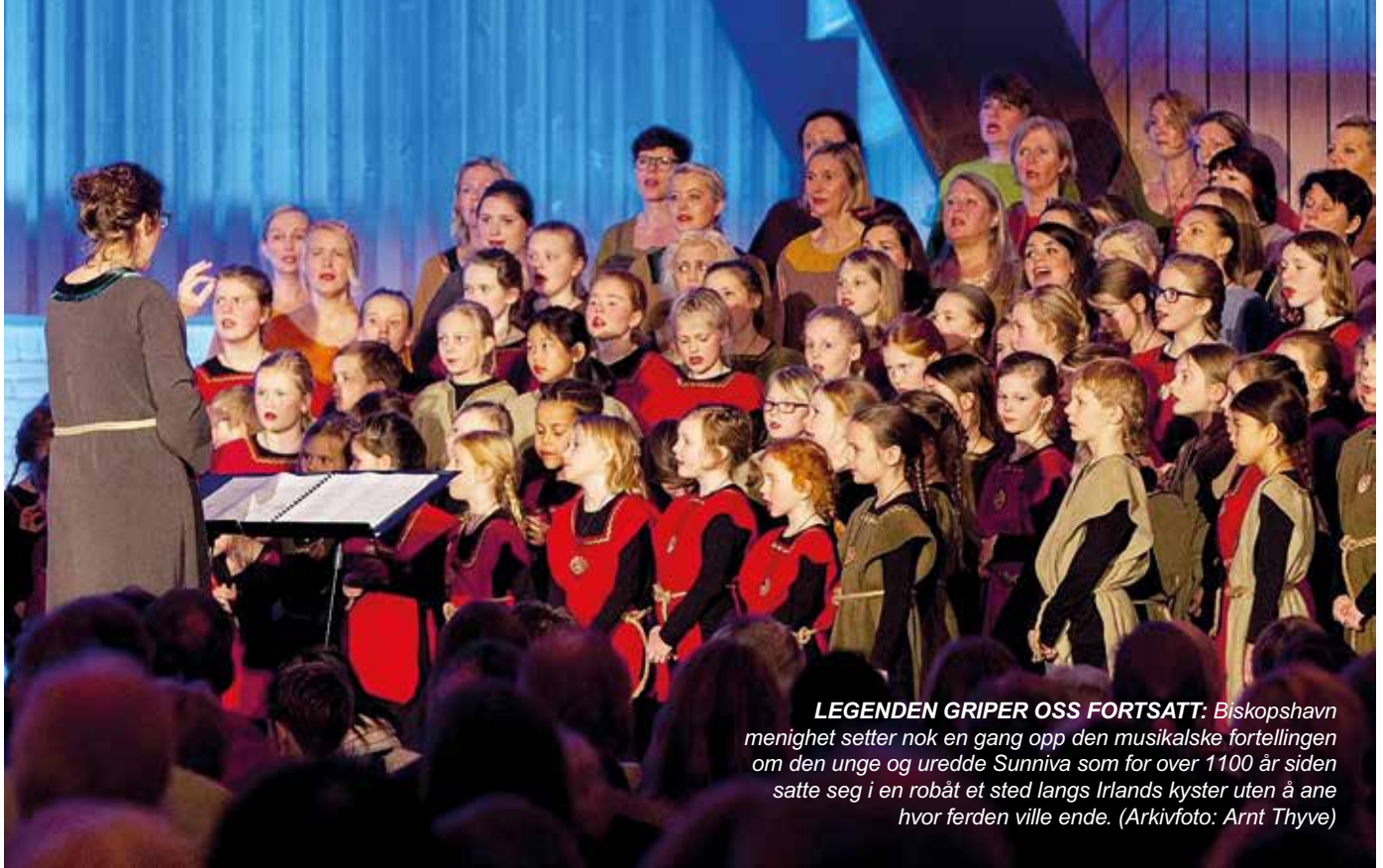
LEGENDEN GRIPER OSS FORTSATT: Biskopshavn menighet setter nok en gang opp den musikalske fortellingen om den unge og uredde Sunniva som for over 1100 år siden satte seg i en robåt et sted langs Irlands kyster uten å ane hvor ferden ville ende.