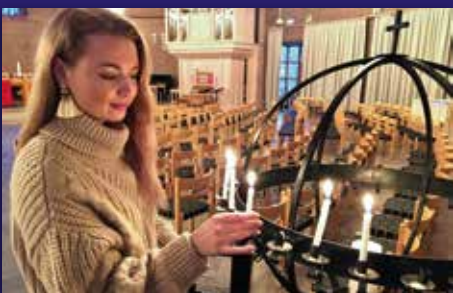
Åpner opp kirken Side 4