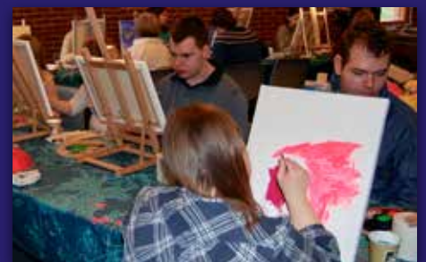
10 år med Klubb+ Side 18