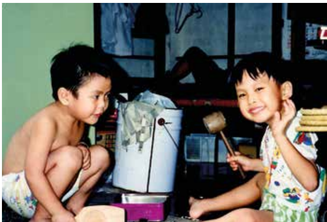
BLE MØTT MED VENNLIGHET: «I Beijing virket det som om alle kom deg i møte og ønsket å forstå det du sa» skriver Thrude Deisz. (Foto: Thrude Deisz).

Da vi kom til passkontrollen kastet den uniformerte kvinnen i glassboden et stivt blikk på oss. Så sprang hun ut og rett bort til meg. Med et enormt glis grep hun tak i noen av flettene mine, klirret henrykt med perlene, ytret en hel del som vitterlig hørt vennlig ut og klappet meg kjærlig på kinnet – før hun ilte tilbake til buret sitt. Jeg nærmest fløt ut i ankomsthallen på silkepoter – i en sky av forbløffet forvirring – og trodde jeg hadde drømt.