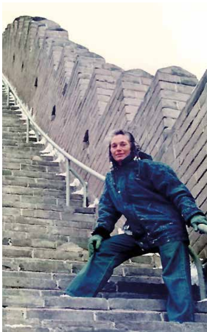
EN MUR TIL ETTERTANKE: Å gå opp trappene til toppen av Den kinesiske mur er en obligatorisk del av det å være turist i Beijing – og en viktig påminnelse inn i vår egen tid, der murene er flere enn noensinne.

I det nye året vil jeg prøve å være mindre forutinntatt, og ikke tro så lett på antakelser – hverken egne eller andres – og gi hvert enkelt menneske en sjanse. «Sku ikke hunden på hårene» heter det. Ikke folk heller, kan jeg legge til.