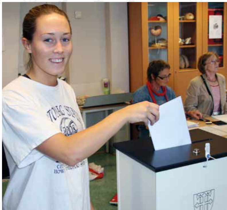
TRENGER KANDIDATER: Kirkevalget finner sted samtidig med kommunevalget, og med mulighet for forhåndsstemming fra 10. august.

En undersøkelse viser at et stort flertall trives og opplever det som meningsfylt å være med i menighetsrådet. 85 prosent