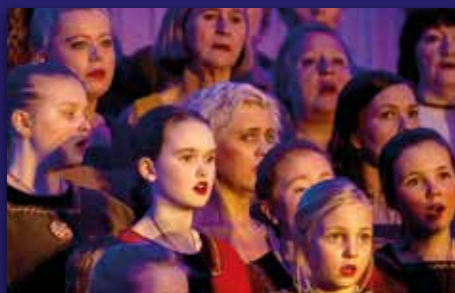
Sangen om St. Sunniva Side 13