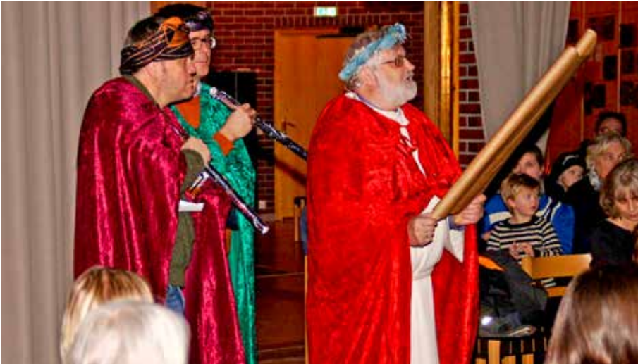
FULGTE STJERNEN: Vi fikk høre fortellingen fra Matteusevangeliet, og så kom de tre vise menn inn.

Og sånn ble det! Lørdag 4. januar strømmet det på med små og store, unge og gamle til juletreffesten i Åsane kirke. Etter å ha blitt ønsket velkommen fikk alle gå inn i en av menighetssalene for å bli utstyrt med hatter og kikkerter som kunne dekorerer med alle slags flotte klistremerker.