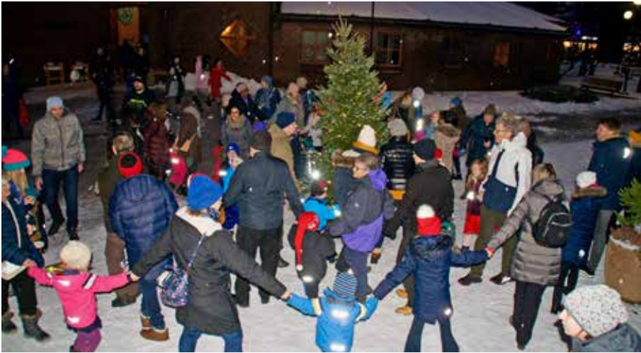
GANG RUNDT JULETREET: Det ble tre ringer rundt juletreet, og mange av de kjente kjære julesangene tonet ut i vinterkvelden.