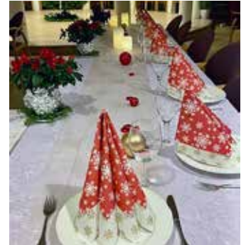
Nydelig oppdekking til julemiddag i Torgstuen.

– Jeg har feiret tradisjonell jul i 87 år, så nå var det godt å gjøre noe litt annerledes. Fylt av julestemning, og gode juleønsker gikk jeg ut i julekvelden, møtt av vakker klokkeklang. Det var jul!