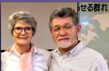
Kristenarbeid under tyfonens herjinger Side 9-11