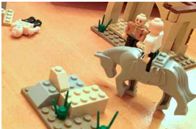
BIBLO-SAMLING FOR 7-ÅRINGER: Her blir historien om den gode samaritan iscenesatt ved hjelp av byggeklosser.

som møter opp får utlevert pekeboken Lille sau går seg vill. Vi starter med menighetsmiddag for så å fortsette med programopplegget inne i kirkerommet. Invitasjon i posten.