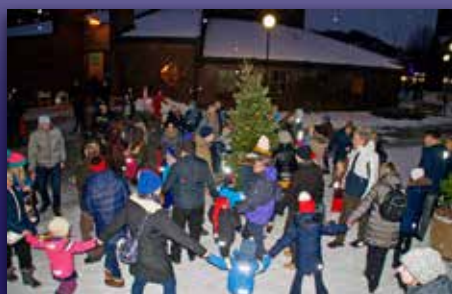
Vinterlig juletefest Side 19