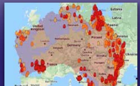
Australia brenner Side 6-7