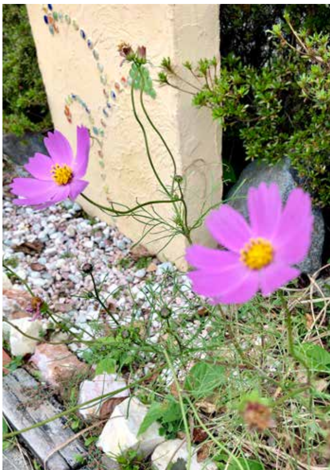
TÅLTE TYFONEN: Ville kosmos-blomster hjemme i ekteparets hage.

med forfedre-dyrkelse. Eldste sønn har gjerne forfedrealter i sitt hjem, der det settes fram ris og vann hver dag til avdøde foreldre og besteforeldre, og man snakker til sine avdøde der.