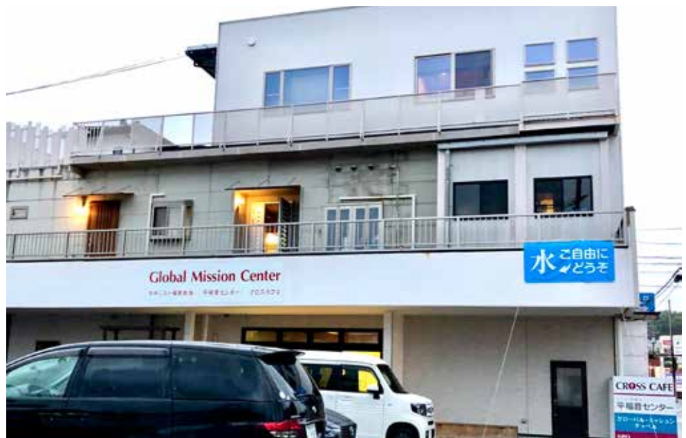
HER ER KIRKEDØRENE ALLTID ÅPNE: Da tyfonen herjet i oktober i fjor, kom folk de ikke kjente og brukte dusjer og bad og vaskemaskin. Flere overnattet også.

De fleste shintoistene regner seg også for buddhister. Her er det i hvert fall seks ulike retninger, men de fleste japanere er bundet til japansk buddhisme på grunn av dens oppblanding