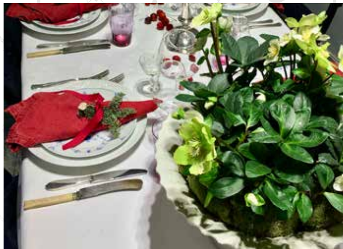
JULEROSE BRUKT TIL BORDDEKNING: Det er nydelig å se julerose i krukke, gjerne med mose som skjuler pottekanten.

Den blomstrer langt utover våren, men etter hvert kommer det brune flekker på bladene og noen av blomstene. Klipp da av bladene helt nede ved roten. Da vil soppen – som du ser i det brune på bladene – ikke spre seg til blomsten. Bladene vil