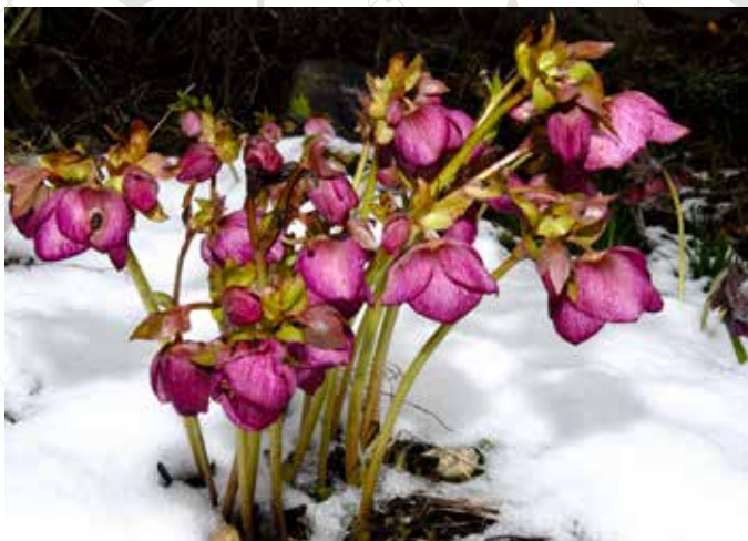
«ANNA'S RED» I HVIT SNØ: Nesten uvirkelig med så store vakre blomster i snølandskap. De klarer seg bra, om det er godt drenert og ikke surt jordsmonn.

Carol, som har pent blågrønt bladverk og kompakt vekst. Kremhvite blomster på rødlige blomsterstengler. Etter hvert som blomstene eldes får de et vakkert rosa fargeskjær. En av flere gode sorter i serien Gold Collection.