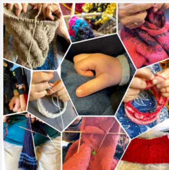
Collage med noen av våre produkter (foto og arrangement: Bente Lill Madsen)

Totalt i 2020 har vi altså gitt 8037 kroner til misjonsprosjektet i Thailand. Siden starten i 2016 har vi samlet inn over 40.000 kroner. Det synes vi er bra gjort av en liten gjeng håndverksglade mennesker. Vi ønsker gjerne flere velkommen på treffene våre. Lik Facebook-gruppen «Håndverkstreff i Åsane kirke» – der blir alle treffdatoer og -steder annonsert.