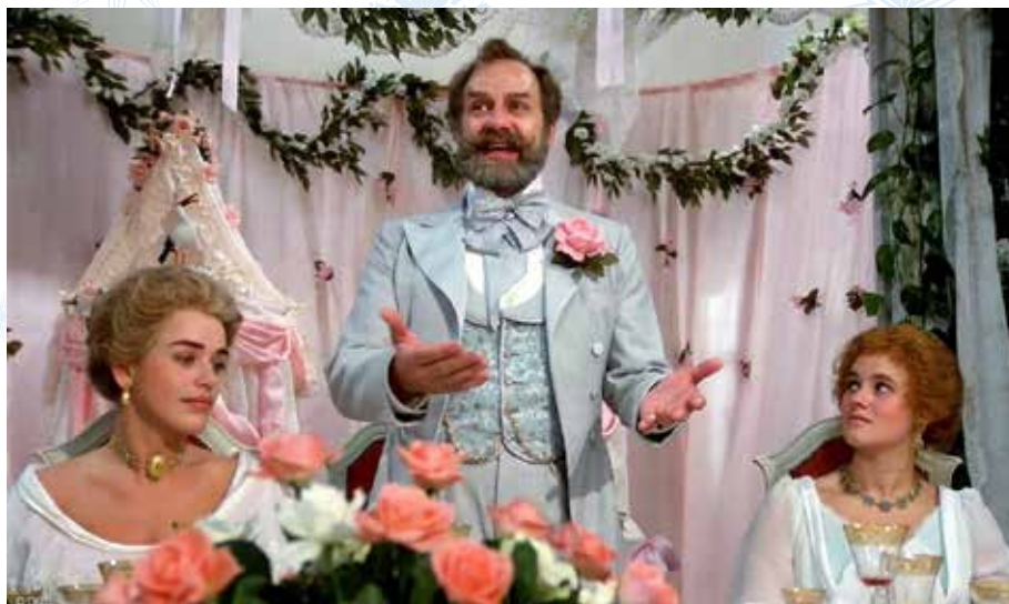
VIKTIG JULEBUDSKAP: Gustav Adolf råder sine nærmeste til, i god kristen ånd, å være snille, generøse, milde og gode.

Tv-versjonen av Fanny og Alexander er inndelt i fem episoder, og er nesten dobbelt så lang som filmen (totalt 312 minutter mot filmens 188). Dermed passer den fint til å deles opp i passende konfektdoser frem mot jul. For julen står sentralt i denne fortellingen, som både begynner og slutter med julefeiringen hjemme hos de to barnas livsglade mormor Helena Ekdahl (Gunn Wållgren).