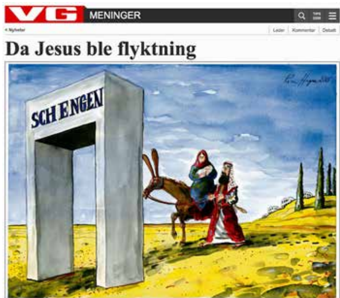
JESUS SOM FLYKTNING: Julen 2015 skrev VG-kommentator Per Olav Ødegård en artikkel om flyktningkrisen, illustrert med avistegner Roar Hagens oppdaterte versjon over et lett gjenkjennelig motiv.

Og julen 2015 hadde VG en artikkel om flyktningkrisen (se vg.no/nyheter/meninger/syria/da-jesus-ble-flyktning/a/23584591 ) med en usedvanlig krass variasjon av et lett gjenkjennelig motiv.