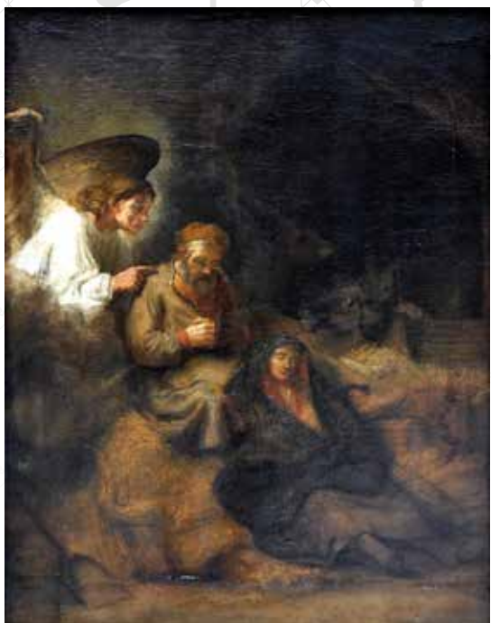
JOSEFS DRØM: Rembrandt (1606-1669) har skildret Josefs drøm: engelen som kommer til et utslitt og sovende par med et nyfødt barn; i en helt alminnelig stall.