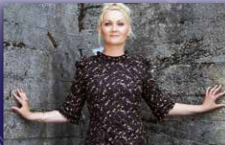
Klar for Draumkvedet Side 13