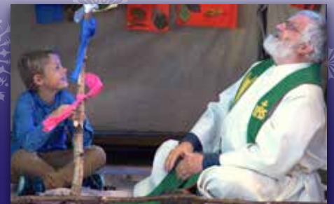
Nytt fra trosopplæringen Side 19