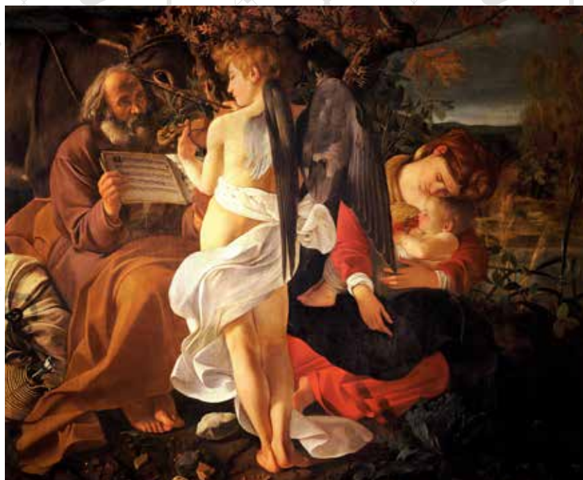
HVILEPAUSE: Caravaggios (1571-1610) frodige bilde av Josef som holder noteheftet for engelen som spiller Maria og Jesus i søvn.

kom til Israels land. Men da han fikk høre at Arkelaos var blitt konge i Judea etter sin far Herodes, våget han ikke å slå seg ned der» (Matt. 2, 21-22). Arkelaos var en like voldelig rå hersker som sin far. Familien slo seg derfor ned i Nasaret. «Slik skulle det ordet oppfylles som er talt gjennom profetene, at han skulle kalles en nasareer» (Matt. 2, 23)