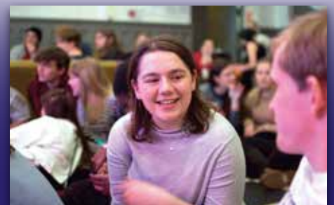
TGIF i kulturkirken Side 2-3