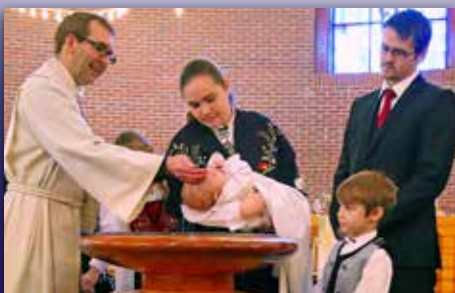
Flere velger dåp Side 4