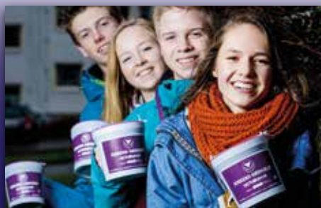
Ta godt imot bøssebærerne! Side 14-15