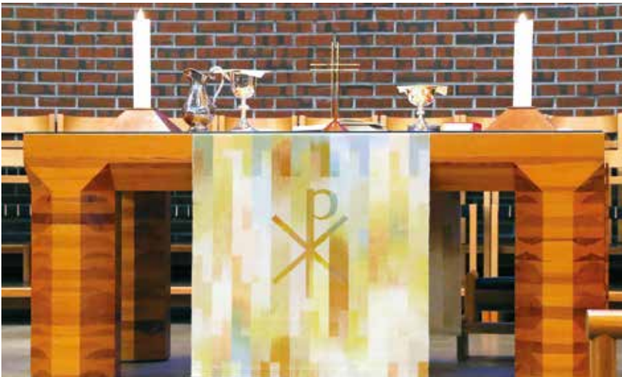
NYE ALTERDUKER: Åsane kirke har fått ny liturgiske tekstiler på alter, prekestol og lesepult.