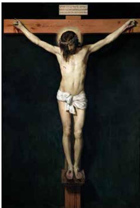
DØDE FOR AT VI SKULLE GÅ FRI: Jesus døde og sonet for alle menneskers overtredelser i fortid, nåtid og framtid. (Illustrasjon: Korsfestelsen av Jesus, oljemaleri fra 1632 av Diego Velázquez).

Jødiske kulturen der Jesus hadde sitt virkefelt, hadde en klar overbevisning om sin oppgave, han visste hva han skulle og hvorfor.