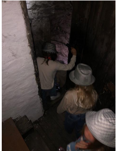
Tårnagenter på tårntur i domkirken

Over påske ble 10-åringene invitert til påskesamling i Johanneskirken en tirsdag i forbindelse med «Aftenbønn og kvelds». Her var familier og søsken også invitert med, og de fikk vite litt om kirkens påskefeiring, vi spiste kveldsmat sammen og de fikk lage påske/ vår-bilder. Familiene ble også invitert til påskefestgudstjeneste i Johanneskirken søndag samme uke.