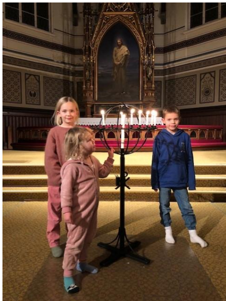
Ny lysglobe i Johanneskirken

7-åringene fikk invitasjon til å komme på «Aftenbønn og kveldsmat» i Johanneskirken. Tema var jul og barna løste oppgaver i kirkerommet knyttet til jul og julefeiring. Denne kvelden hadde vi også høytidelig avduking av den nye lysgloben i Johanneskirken som er i barnehøyde.