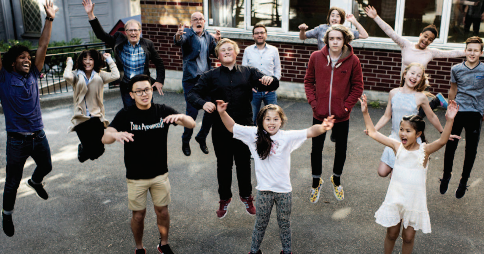
FARGER OG MANGFOLD: Platetittelen, Colours, er et uttrykk for orgelklubbens mangfold både når det gjelder musikk, utøvere og kulturell bakgrunn.