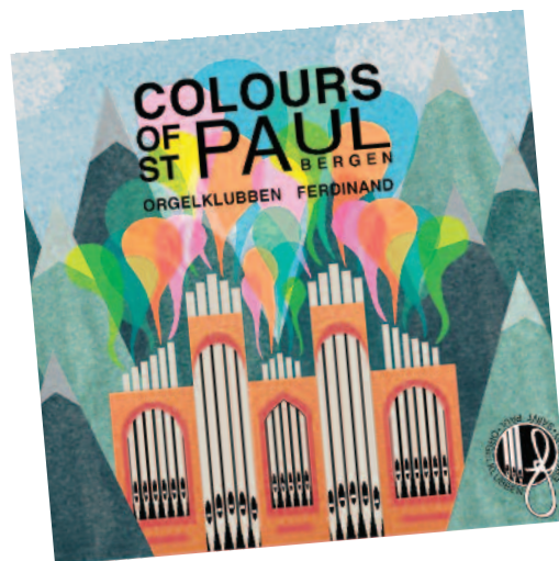
PLATE: Dobbelt-cden «Colours of St. Paul» er utgitt av Cantando Musikkforlag, og inneholder innspillinger gjort både av orgelklubbens elever, lærere og profesjonelle organister.

Platetittelen, Colours of St. Paul , er derfor et uttrykk for mangfoldet både når det gjelder musikk, utøvere og kulturell bakgrunn. ■