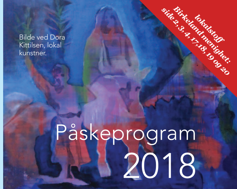
Bilde ved Dora Kittilsen, lokal kunstner.

lokaltstoff Birkeland menighet: side 2, 3, 4, 17, 18, 19 og 20