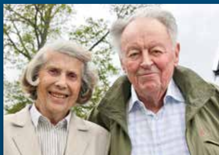
MINNEORD: To som bygget menighet Side 2-3