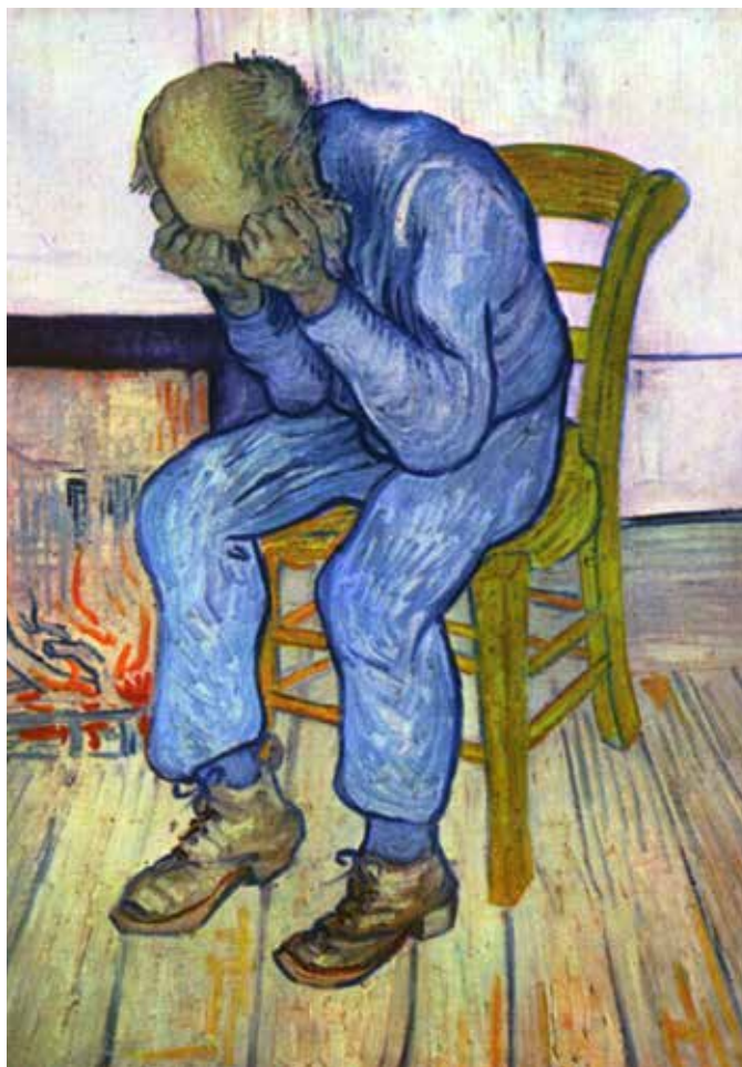
DU ER IKKE ALENE: Familie, venner er glad i deg og står sammen med deg – selv om det ikke kjennes slik når du har det vondt inni deg. (Illustrasjon: Oljemaleri av Vincent van Gogh)

Hva trenger en som er i det dypeste mørke? En som selv forsøkte å ta livet sitt som tenåring, sier det slik utifra sin erfaring: «Du kan ønske, håpe og jobbe for at jeg får det bedre, så raskt som mulig. Bare vis meg at du orker mitt mørke. At du holder ut med å vente. At det ikke haster med å få meg ut for alle dere andres skyld. Da kan det hende det blir litt vanskeligere å tro på den indre stemmen som stadig forteller meg at det blir bedre om jeg forsvinner.»