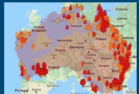
Australia brenner Side 6-7