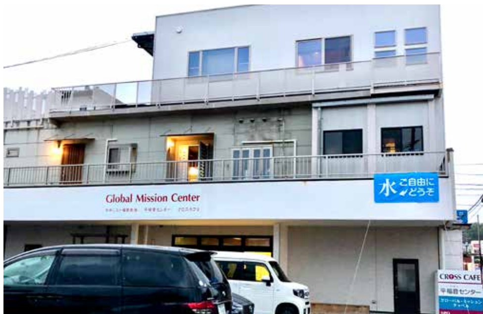
HER ER KIRKEDØRENE ALLTID ÅPNE: Da tyfonen herjet i oktober i fjor, kom folk de ikke kjente og brukte dusjer og bad og vaskemaskin. Flere overnattet også.

De fleste shintoistene regner seg også for buddhister. Her er det i hvert fall seks ulike retninger, men de fleste japanere er bundet til japansk buddhisme på grunn av dens oppblanding