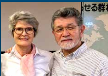
Kristenarbeid under tyfonens herjinger Side 9-11