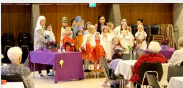
Barnekorene besøker eldretreffet