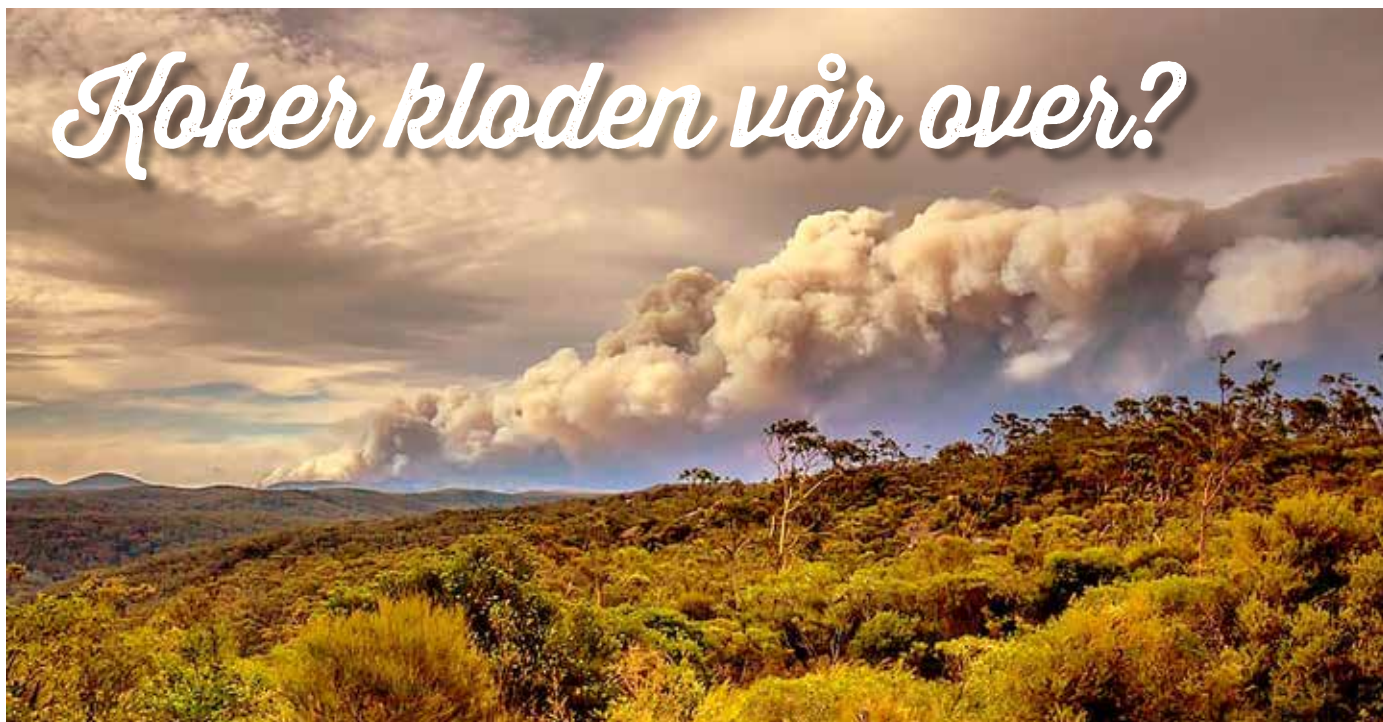
SKOGBRANNER I AUSTRALIA: Knusktørr vegetasjon og vind gjør at det er vanskelig å få kontroll over flammene i Australia. Bildet er fra Gaspers Mountain i desember 2019 – der et område på 5000 kvadratkilometer (omtrent en tredjedel av Hordaland) er rammet.

Vi kan ikke forvente at folkerike utviklingsland skal redusere sine utslipp dersom vi, i verdens beste land å bo i, ikke vil gjøre noe med våre utslipp. Men for å klare det må vi endre måten vi lever på.