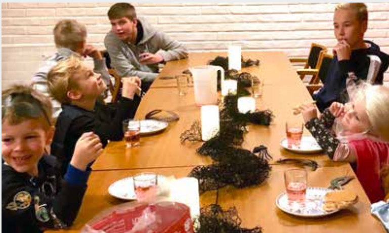
MARKERTE ALLEHELGENSDAG: Barna fikk kle seg ut, lage masker og leke.

På Barneklubben snakker vi ikke så mye om døden, det er ikke noe enkelt tema for barn, men vi snakker om Jesus, at han tar imot oss og holder oss i hånden uansett hva vi har gjort eller hva som skjer.