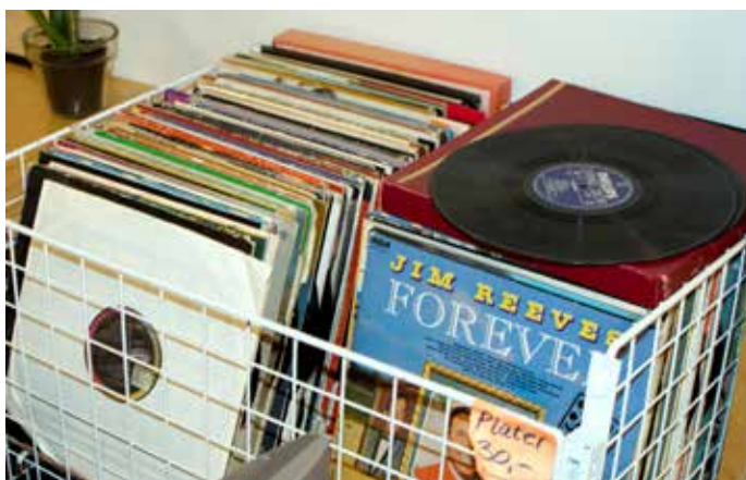
SVART GULL: Gamle vinylplater er både sjarmerende og kan inneholde ukjente skatter for musikkfrelste.

– Da sitter de her og strikker, men egentlig er det åpent for alt av håndverk. Jeg har sagt at neste gang Håndverkstreffet kommer, så tar jeg med meg en trebit og en kniv, så kan vi spikke litt.