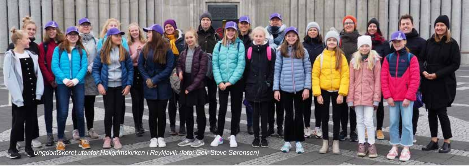
Ungdomskoret utenfor Hallgrímskirken i Reykjavík