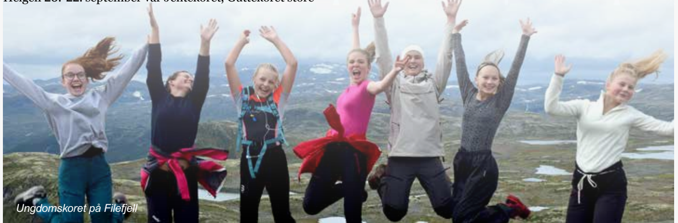
Ungdomskoret på Filefjell

Annet hvert år reiser Biskopshavn ungdomskor på utenlandstur. I begynnelsen av oktober gikk turen til Island! Det ble en flott og innholdsrik tur med besøk til Gullfoss, shopping i Reykjavík, bading i varme kilder – og popup-konserter i Hallgrímskirken og foajeen i Harpan konserthus.