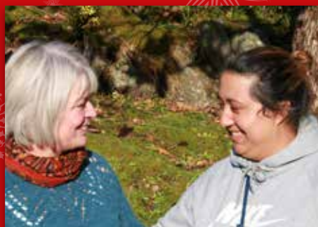
Ein velsigna venskap Side 12-13