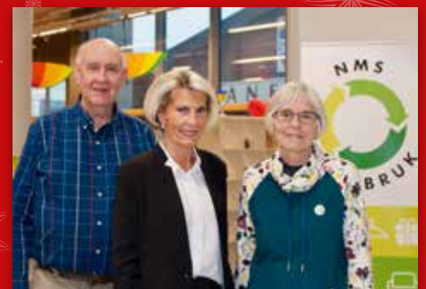
Miljø, misjon og møteplass Side 6-7