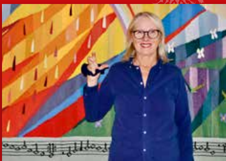
Ja-mennesket Side 2-3