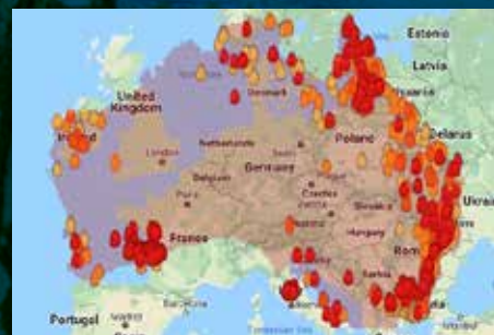
Australia brenner Side 6-7