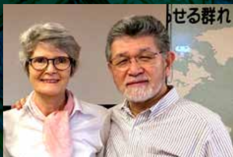
Kristenarbeid under tyfonens herjinger Side 9-11