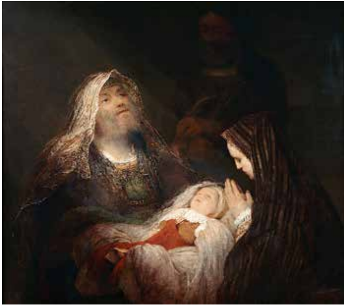
SIMEONS LOVSANG: Det er lengselen som har båret ham frem til dette øyeblikket. Nå har lengselen fått svar. (Illustrasjon: Oljemaleri av Aert de Gelder)

TEKST ER AV AAGE MJELDHEIM OG LINA TALHAUG.