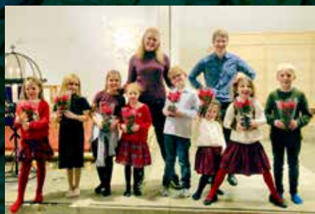
Bli med i Musikkverkstedet! Side 4