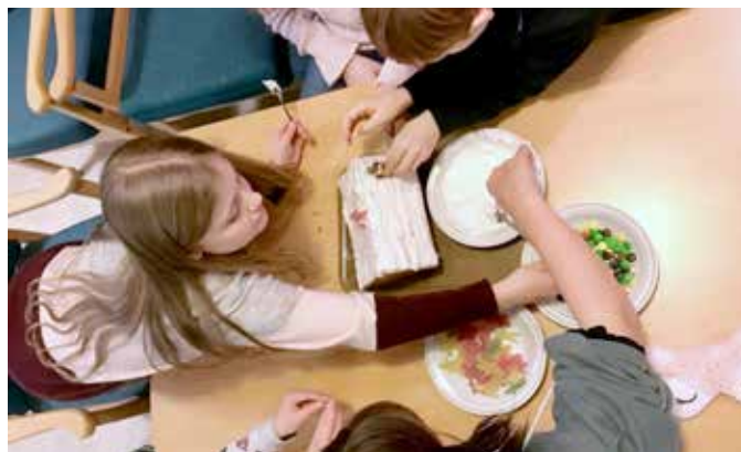
HVEM LAGER DET FINESTE HUSET?: Alle fikk være med å pynte pepperkakehus til kirkekaffen dagen etter.

Kveldens nest siste post var film og lørdagsgodt – alle fant seg godt til rette med soveposer og dyner, og så Grinchen sammen. Helt til slutt på kvelden gikk vi ut og tente bål, og hadde en liten kveldsavslutning der.