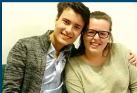
Starter ny ungdomsklubb Side 3