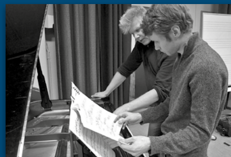
Symfonikonsert i Eidsvåg Side 19