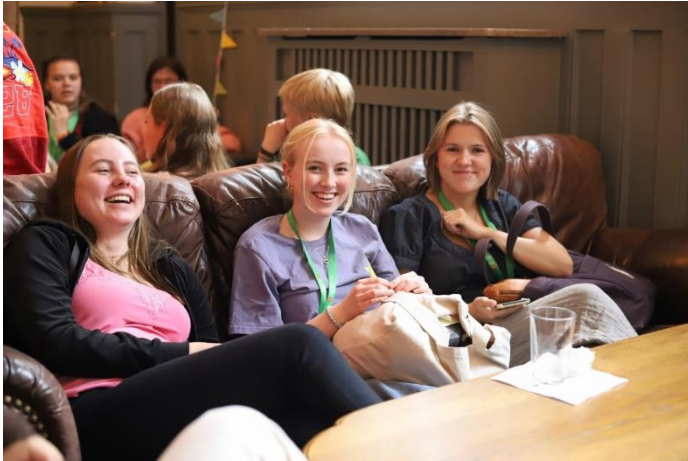
Ungdommer fra Fana på Veikryss.

her fikk ungdommene mulighet til å lære om og delta i kirka sitt ungdomsdemokrati. Inspirasjonssamlingen var en helg hvor ungdommene fikk knytte vennskap med andre engasjerte ungdommer i kirken, og fikk påfyll og inspirasjon til å drive det lokale ungdomsarbeidet fremover. Helgen var fylt med sang og musikk, forkynning, workshops, diskusjoner, lek og moro, god mat og sosialt samvær med nye venner. I tillegg til Ungdomstinget, underholdningskveld og kveldssamlinger, fikk ungdommene som deltar på lederkurset MILK i KFUK-KFUM Fana sin første ledersamling denne helga. Det hele ble avsluttet på søndagen med gudstjeneste sammen med menigheten i Johanneskirken.