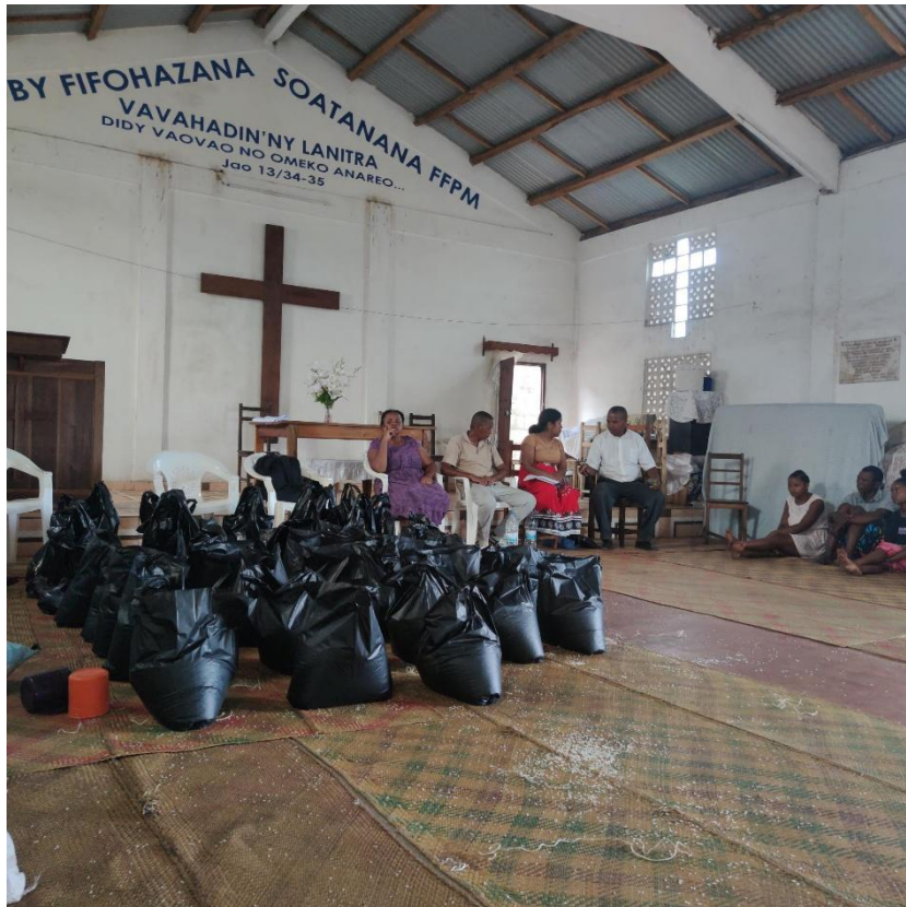
Hjelp til Madagaskar

NMS - Hjelpen kommer fram til syklonofrene