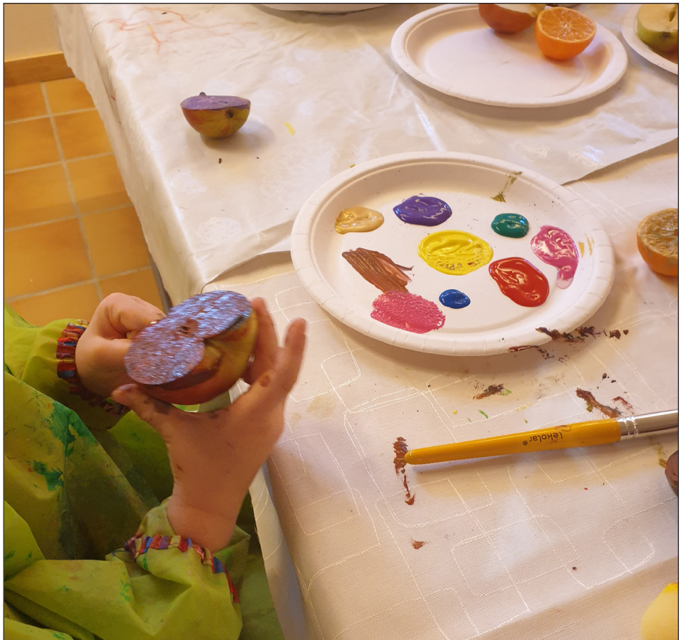
I Åpen barnehage har de ulike og nye aktiviteter for barna hver dag som tar utgangspunkt i samme rammeplan som for ordinære barnehager.

- I barnehagen vår kan koronabarn møte andre koronabarn. Det kan være litt skummelt når de andre barna kommer for nærme. Da er det godt å ha en mamma eller pappa å krype tett inntil. Etterhvert ser de at de små kroppene som ligner litt på dem selv ikke er så skumle likevel. Små barn er taktile og sanser med hele kroppen.