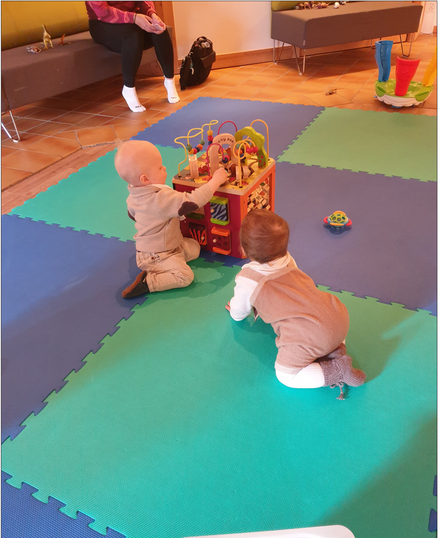
Åpen barnehage, for tiden i Bønes kirke.