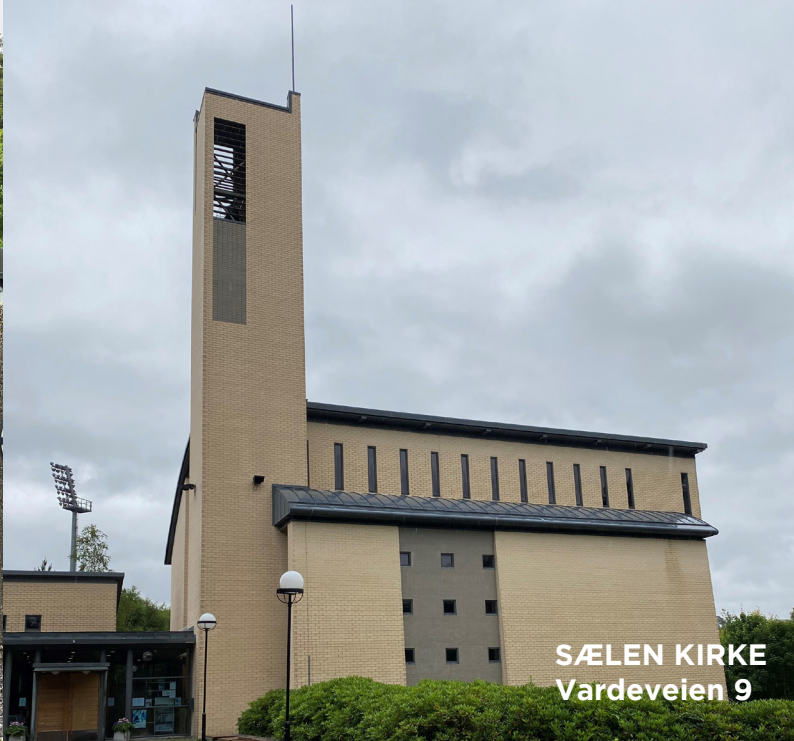
SÆLEN KIRKE Vardeveien 9