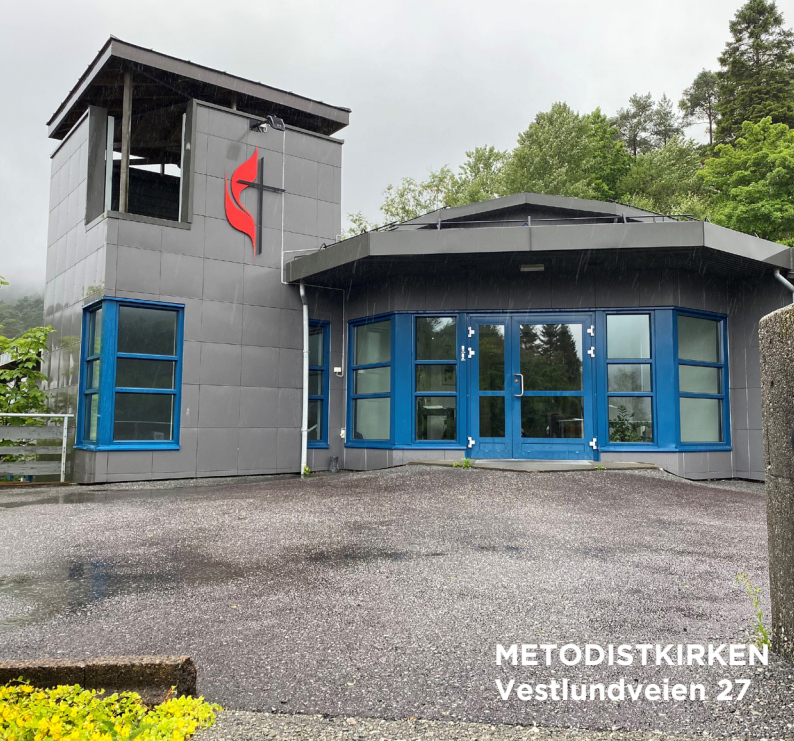
METODISTKIRKEN Vestlundveien 27