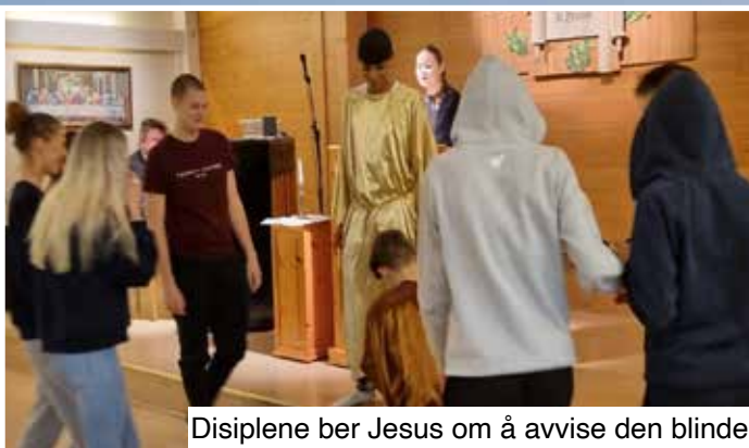
Disiplene ber Jesus om å avvise den blinde

Konfirmanter både fra Nygård og Laksevåg var på det flotte stedet vi har vært i mange år, Fjell-ly på Sotra. Det er Midthordland Indremisjon sin leirplass, som ligger i naturskjønne omgivelser på Møvik i Øygarden kommune.