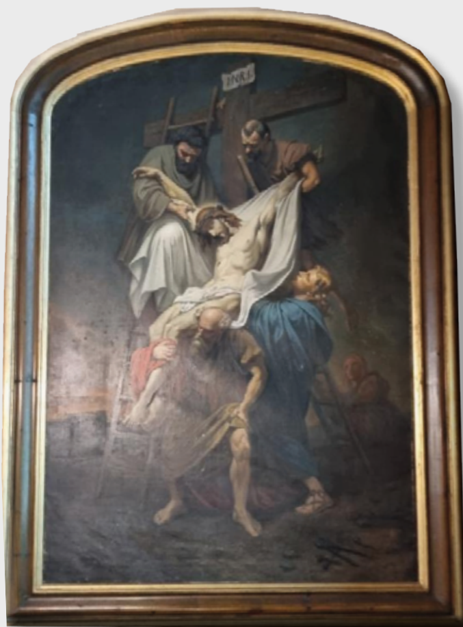
Laksevåg kirke. Kirkens gamle altertavle som er en kopi av kunstnerens Rubens «Jesus tas ned av korset»

Av korset død de tok deg ned og bar deg hen til graven, du tok ditt stille hvilested blant urtene i haven. Derved du ble Guds grønne kvist som blomstret visst, og evig liv ble gaven!