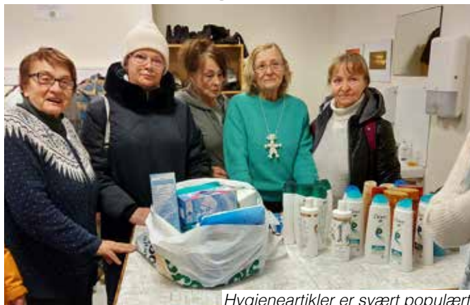
Hygieneartikler er svært populært.