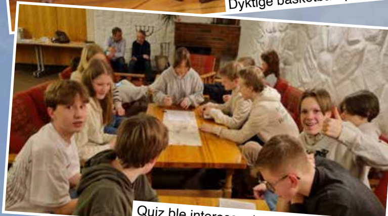
Quiz ble interessant og premiene var fine

En takk til foreldre og andre ledere for flott innsats. Det ble mye latter og humor underveis, så ingen kjedet seg! Og premier ble utdelt til alle vinnerne av beste idrettsaktivitet og kveldsunderholdning.