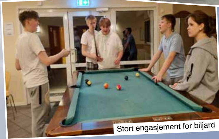
Stort engasjement for biljard

Maten på leirstedet hadde høy kvalitet og vertskapet var svært hyggelig og stod alltid til tjeneste.