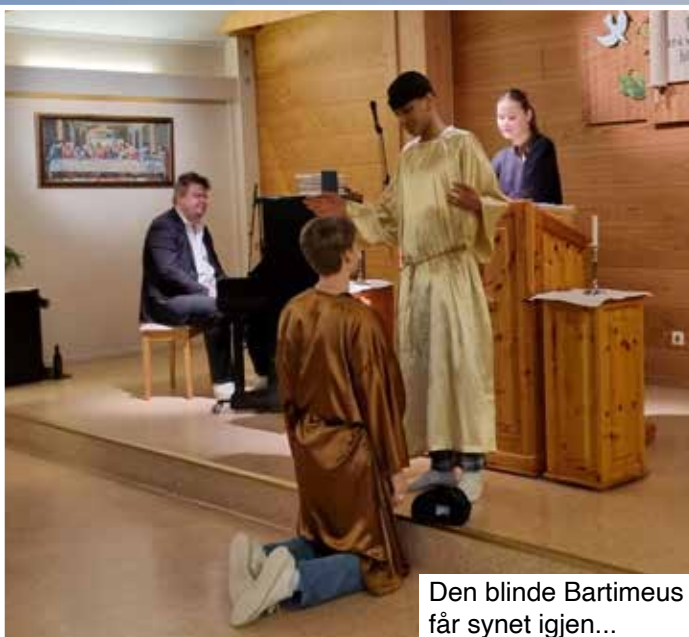
Den blinde Bartimeus får synet igjen...