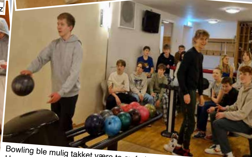
Bowling ble mulig takket være to av fedrene til konfirmantene. Husets sjef på området var nemlig bortreist denne helgen.