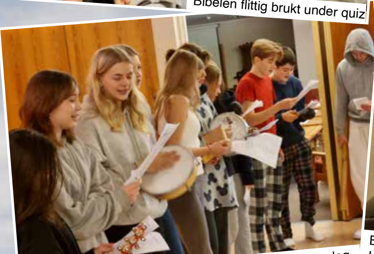
Korgruppe som deltok på gudstjenesten søndag.