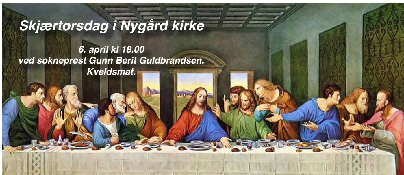
Malt av Leonardo da Vinci 1495-1498

Les annonsene nøye og vær velkommen til våre kirker! Ta godt vare på kirkekalenderen på siste side. Den varer helt til midten av september.