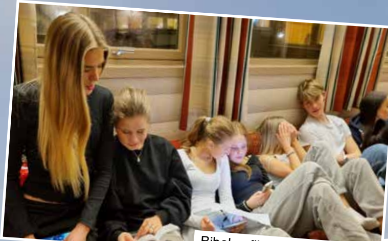
Bibelen flittig brukt under quiz