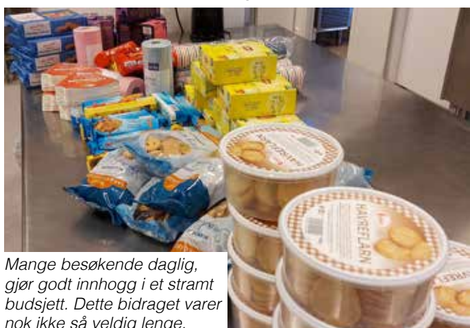
Mange besøkende daglig, gjør godt innhogg i et stramt budsjett. Dette bidraget varer nok ikke så veldig lenge.