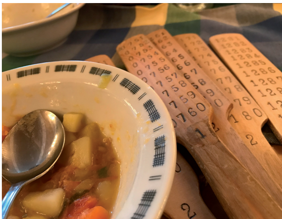
▲ Betasuppe og årer.