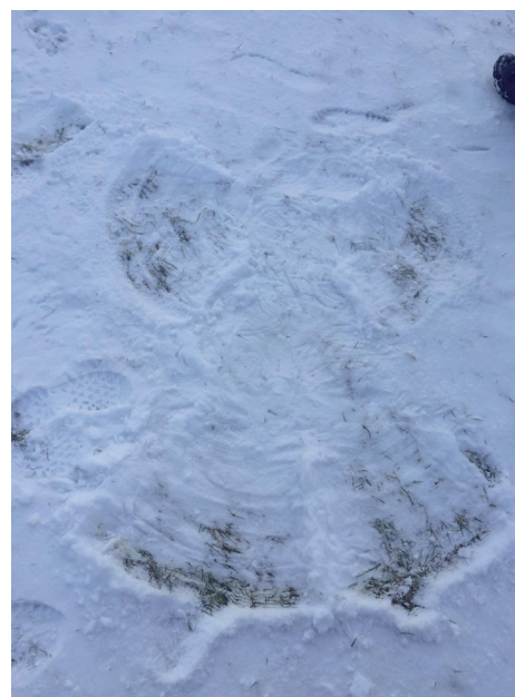
▲ Engler i snøen.