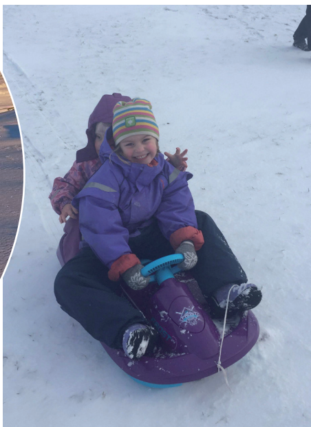
▲ Fuuul fart ned Monatanabakken