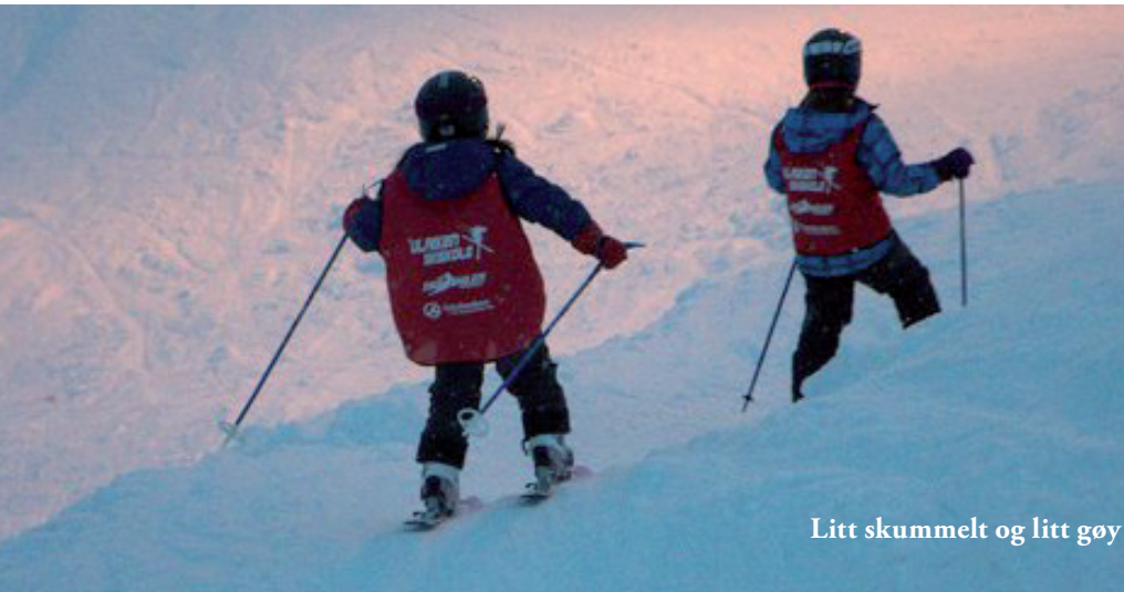
Litt skummelt og litt gøy