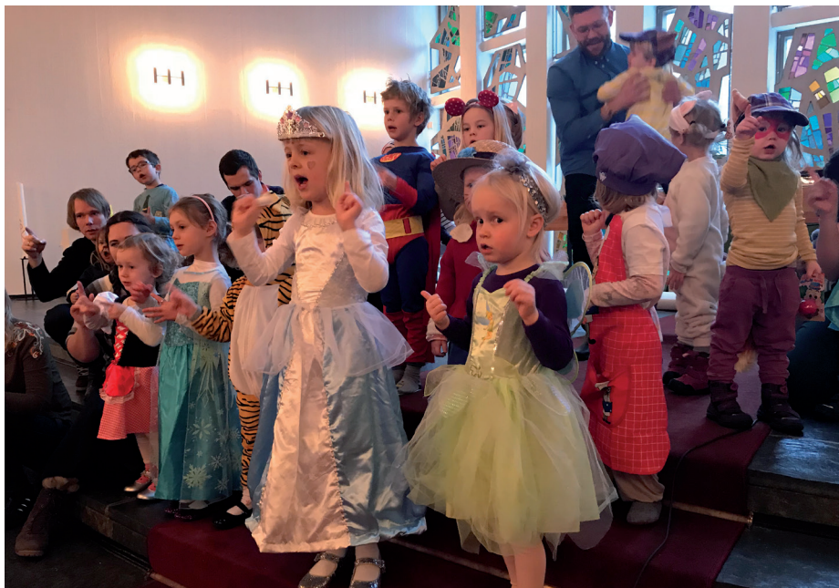
▲ Ungene fremme i koret som synger