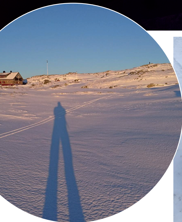
▲ Lange skygger ved Turnerhytten vinteren 2018. Og sesongen er ikke over!