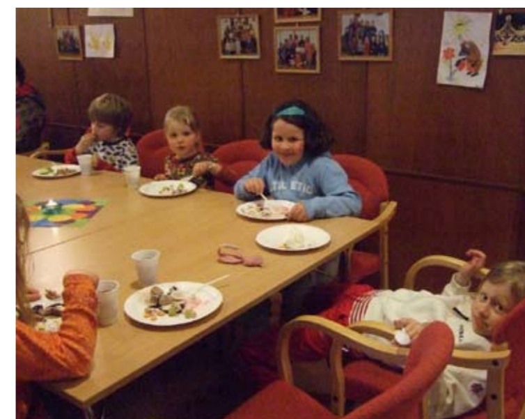
Bildet til venstre og nedenfor er fra barnekoerets avslutningskonsert i Solheim kirke mandag 19. mai. Det var en flott konsert der barna sang nydelig. Etterpå var det iskrem og annet godt i menighetssalen.