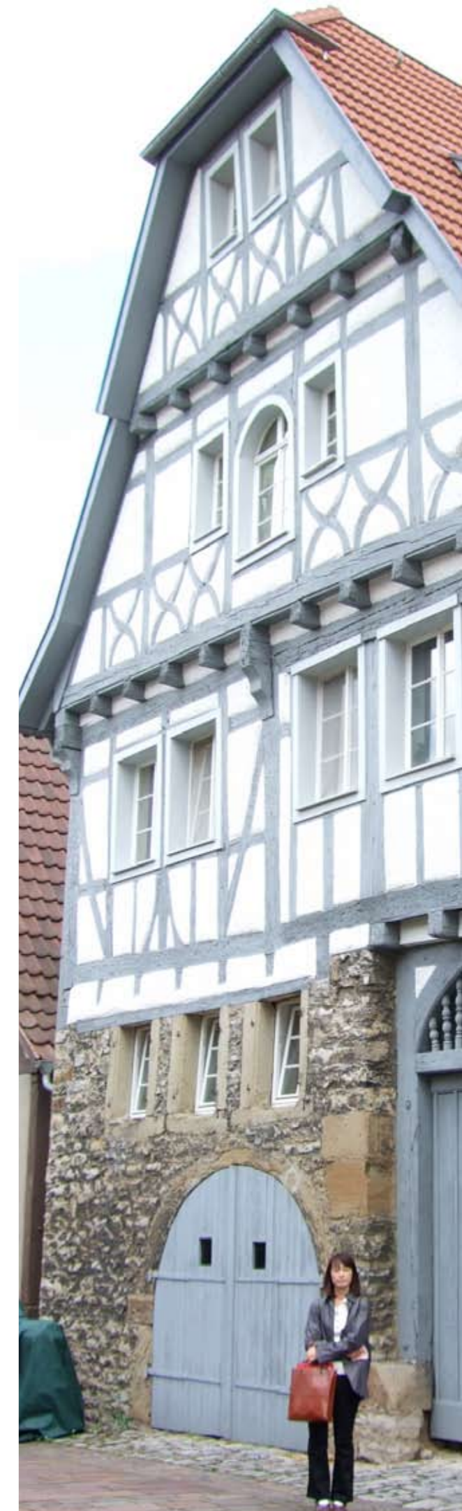
Huset til Obamas forfedre i Besigheim.