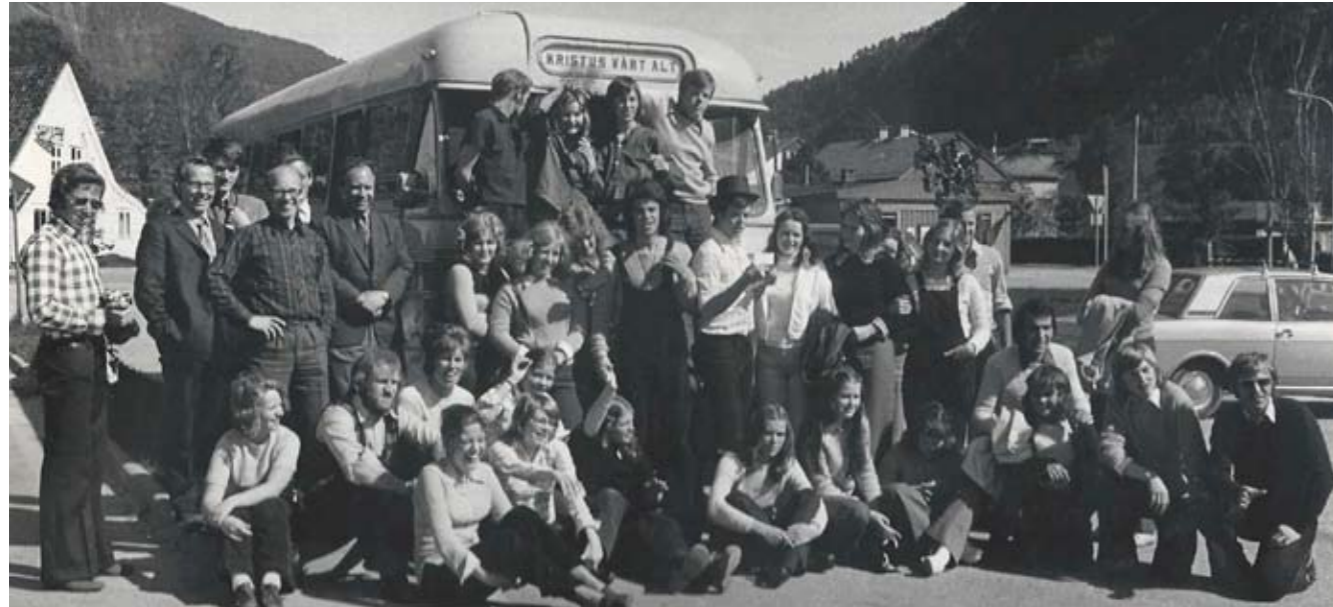
St. Markus Ungdomskor på turne til Førde og Jølster med egen buss fra Ungdomsforeningen.

St. Markus Kirke er 75 år, og jubileet skal feires i en hel uke fra 16. februar. Blant de mange arrangementer vil vi med dette invitere deg til