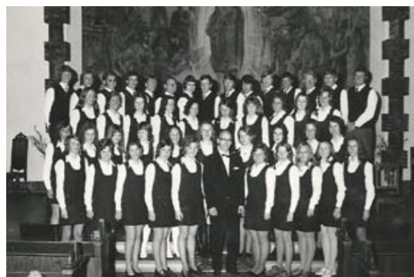
Ungdomsforeningen og Ungdomskoret var to sider ved samme sak – koret om onsdagen og klubben om torsdagen. Den store debatten gikk om skjortelengden til pikene i fremste rad.