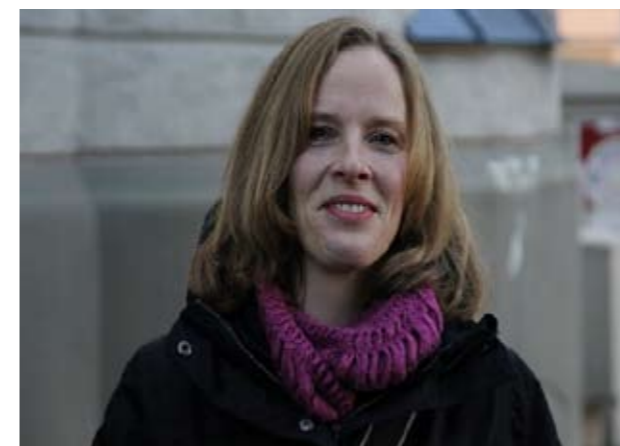
Skuespiller Berit Eggen Solstad