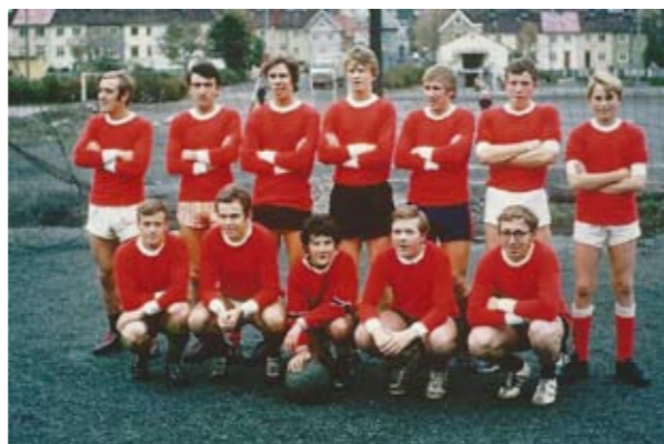
Ungdomsforeningen stilte med eget fotballag og premiesamlingen i menighetshuset krevde etter hvert en egen monter.