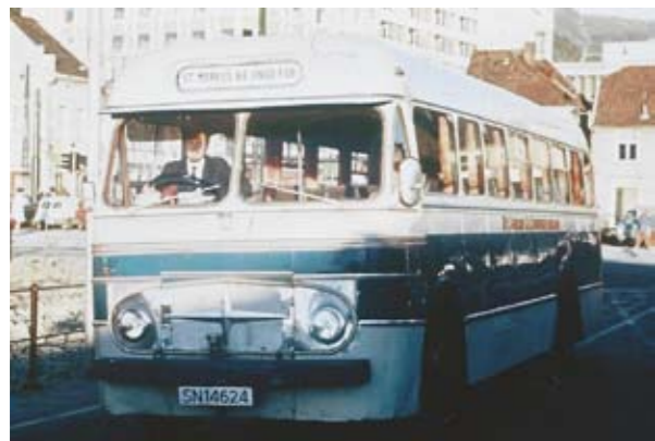
I 1971 kjøpte Ungdomsforeningen en utrangert Os-buss, fornyet den og brukte den i eget arbeid og som inntektskilde ved utleie.