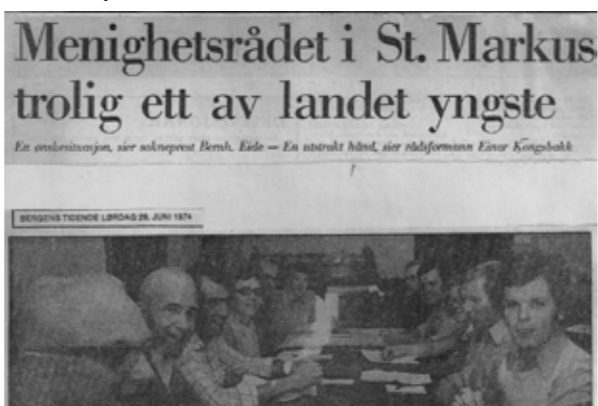
Menighetsrådet i St. Markus på 70-tallet besto stort sett av unge mennesker – med lavets gjennomsnittsalder blant samtlige menighetsråd i landet.