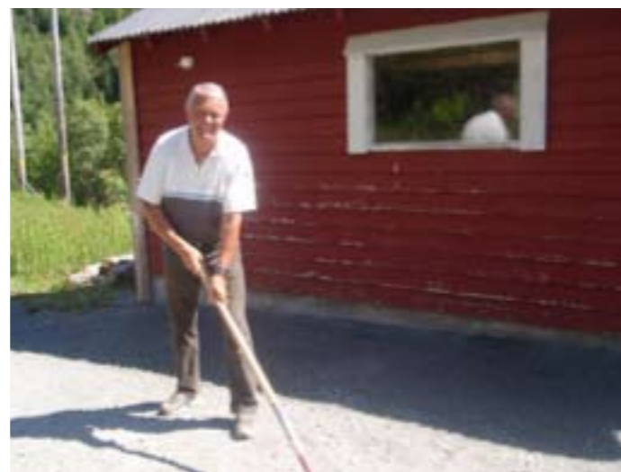
Jevning av grus utenfor boden.