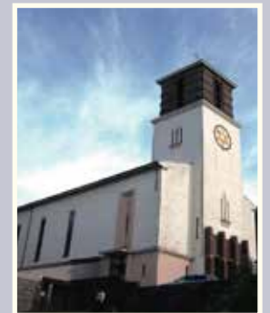
St. Markus kirke Lotheveien 1