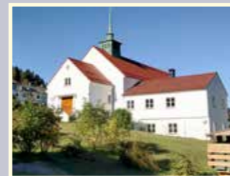
Solheim kirke Hordagaten 28