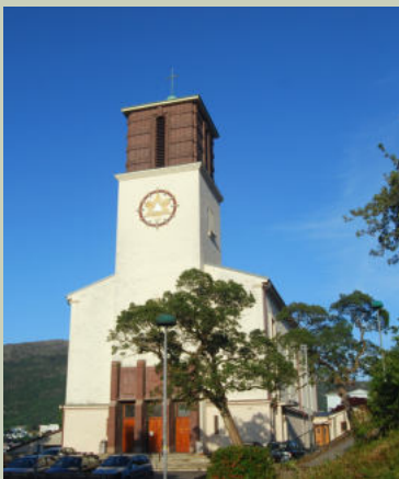
St Markus kirke Lien 45