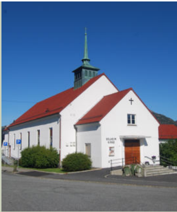
Solheim kirke Hordagaten 28