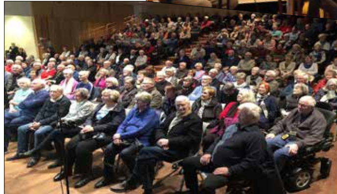
Emne; Beatles og Rolling Stones ballader; Engasjerte medlemmer fyller opp Kultursalen.