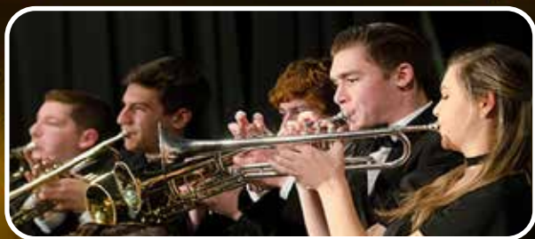
*Lyderhorn Skole Brass