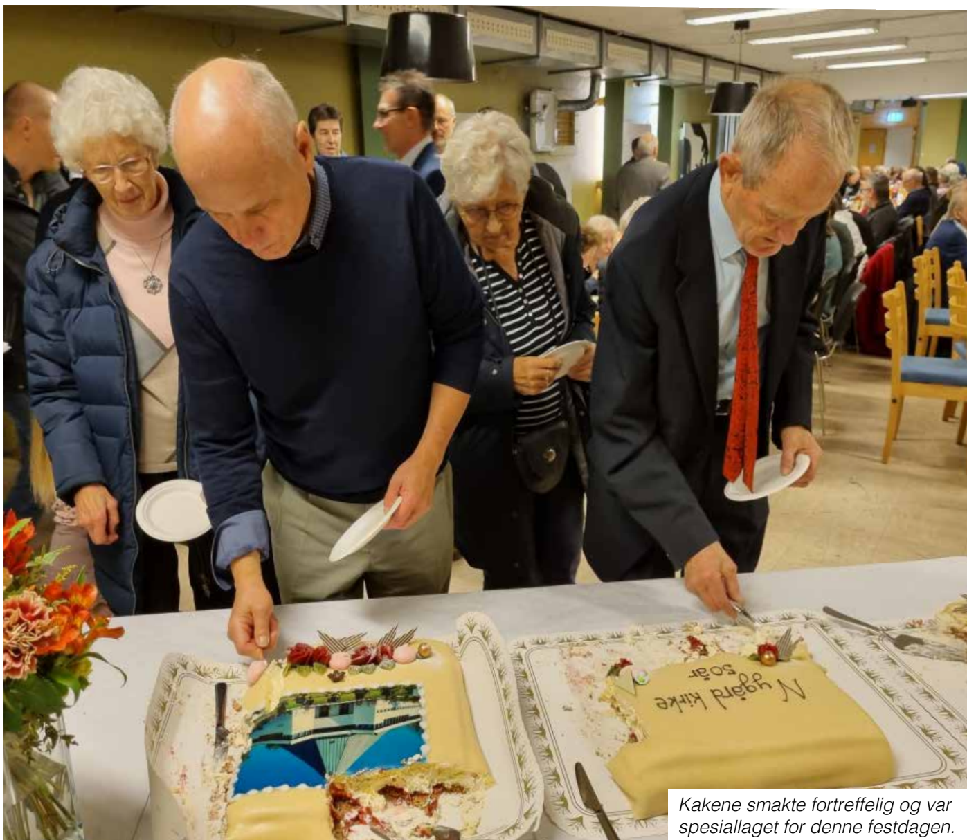
Kakene smakte fortreffelig og var spesiallaget for denne festdagen.