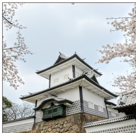
Tekst og foto: Nobukazu Imazu

Du er velkommen til et informasjonsmøte om reisen i Olsvik kirke tirsdag 23. april kl.19:00, dersom du er interessert.