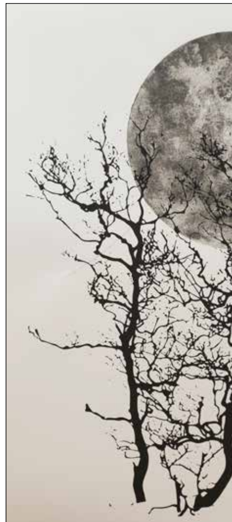
GRAFIKK av E