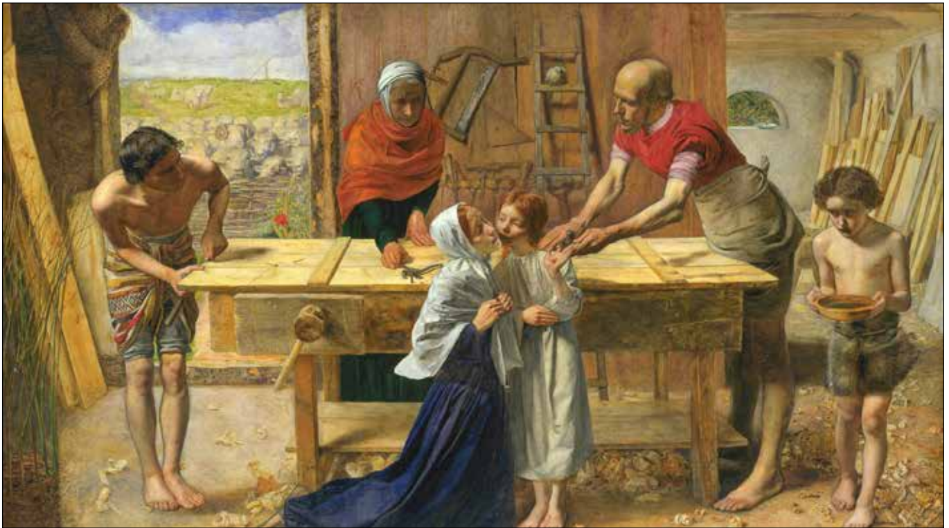
Christ in the House of His Parents ('The Carpenter's Shop') 1849-50; Sir John Everett Millais, Bt 1829-1896; Tate, Purchased with assistance from the Art Fund and various subscribers 1921

Julens hemmelighet - for ikke å si mysterium - er at Gud går inn i menneskekroppen. Det er dette vi kaller «inkarnasjonen» som betyr «å gå inn i kjøttet». Det er kanskje ikke en vakker formulering, men den treffer poenget godt. Når Gud lar sin sønn bli menneske, skjer det ikke i en høyere virkelighet, men på gulvet i et snekkerverksted i småbyen Nasaret.