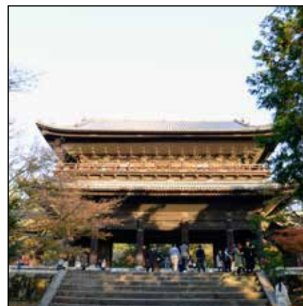
Tekst: Arne I. Tandberg